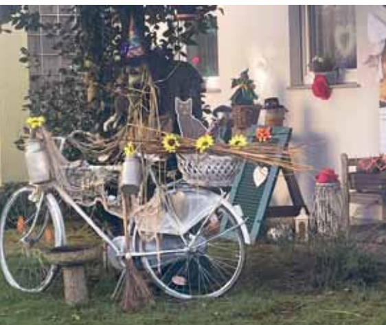
Kunterbunt mit Velo. Wer an seinem Haus liebevoll solch ein Vielerlei inszeniert, verzichtet selten auf ein das Ensemble prägende Fahrrad.