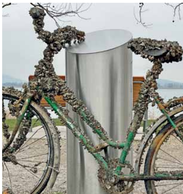
Die Invasion. Martin Kunert hat in Radolfzell ein Fahrrad fotografiert, das für einige Zeit im Bodensee gelegen hatte. Mit Muscheln nun dicht bevölkert. Vor einem Jahrzehnt, in etwa, dürften die ersten Quagga-Muscheln in den Bodensee geraten sein, vermutlich aus dem Schwarzmeer-Raum und eingeschleppt vielleicht mit einem Boot. Diese Muschel stört massiv das Zusammenleben im See, besetzt auch Rohre, Leitungen, Bootsrümpfe – und solche ins Wasser geschmissene Velos.