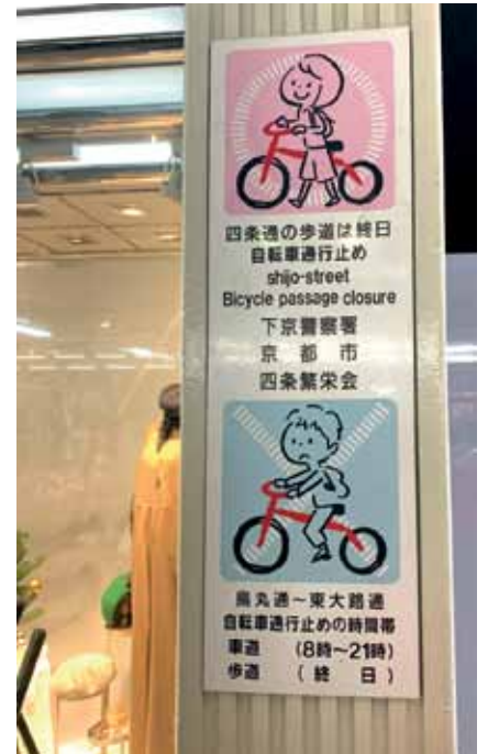
Ja, verstehe. Dieses Foto mailte uns Yvonne Siemann nach einem Besuch in Japan. Dort sind Hinweisschilder zum guten Benehmen beliebt, etliche sind auf Radfahrer gemünzt und verständlich auch für Menschen ohne Japanisch-Kenntnisse.