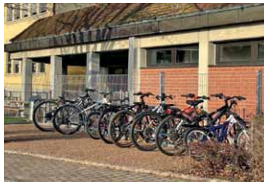
Neu ist dieser Abstellplatz beim Friedhof, Eingang Breslauer Straße (Bild links). Anstellbügel sind auch bei der Alten Schule Haltingen montiert: Wer da Platz findet für sein Fahrrad, schließt es nicht mehr an den Zaun an.