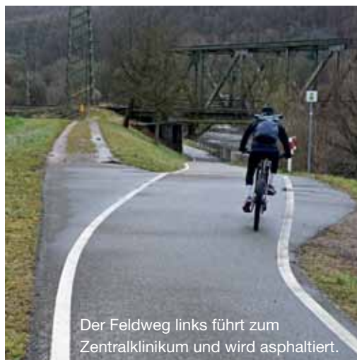
Der Feldweg links führt zum Zentralklinikum und wird asphaltiert.

Die letzten Meter der Basler Straße, hinauf zum Grenzübergang Riehen, werden diesen Mai/Juni erneuert. Nach der Umgestaltung soll für Radler ein zwei Meter breiter Radfahrstreifen mit durchgezogenen Linien markiert werden.