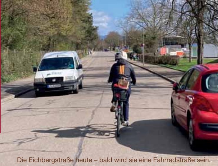
Die Eichbergstraße heute – bald wird sie eine Fahrradstraße sein.