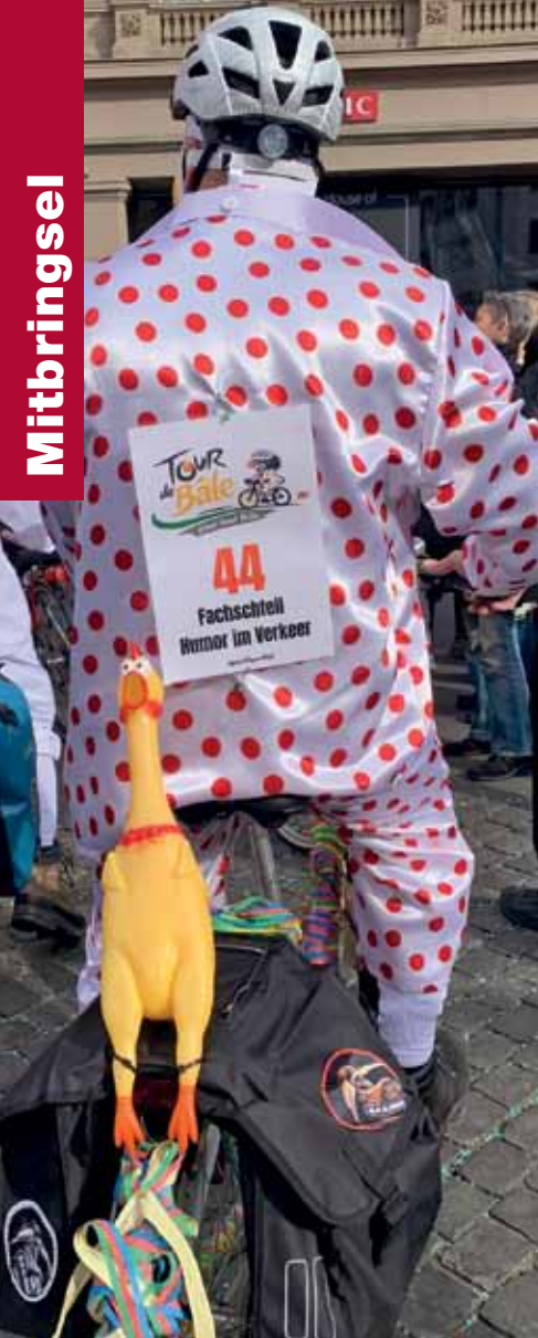
Narren mobil. Fasnächtler in Basel widmen sich immer aufs Neue und gerne dem Velo. Wie hier die Spezi-Clique: Sie hat beim Kanton fürs Einrichten einer „Fachstelle für Humor im Verkehr“ geworben. Yvonne Siemann hat's beim Umzug 2026 gesehen und gleich fotografiert.