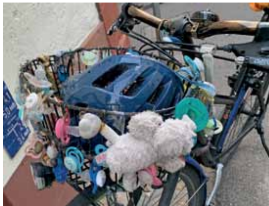
Schnullerig. In Basel, Ecke Nadelberg/Spalenberg, fotografierte Yvonne Siemann dieses Velo mit seinem arg ungewöhnlich geschmückten Korb – Schnuller zuhauf, Plüschtieren.

Mit Dank an Yvonne. Wir können diese so beliebten Mitbringsel nur präsentieren dank aufmerksamer IG Velo-Mitgliedern, die Ausschau halten nach Schönerem, Kurioserem und Witzigem! Nur wenige beliefern uns so gerne und gut wie Yvonne Siemann: Von ihr stammt dieses Mal ein Großteil der Bilder. Besten Dank dafür! Bitte weiter so: Augen auf und Fotos schicken an die Adresse velopost@igvelo.de .