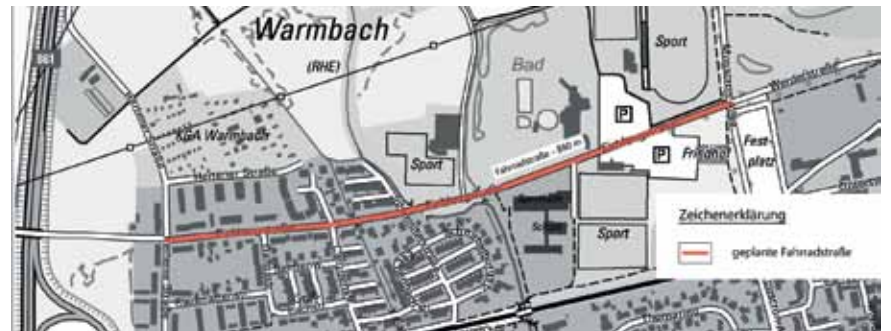
Die Linie der Fahrradstraße, zwischen Mouscron-Allee (rechts) und Hertener Straße.

Umfahrung der Fußgängerzone und die Verbindung von Schulen und Kindergärten, Freizeiteinrichtungen und anderen öffentlichen Einrichtungen. Die Ost-West-Achse verbindet die Innenstadt mit den Außenbezirken. Sie ist ein Teil des touristisch bedeutsamen Hochrheinradwegs (EuroVelo 15/ RadNETZ BW), der entlang des Rheins Städte und Gemeinden verbindet. (gz)