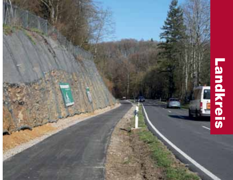
Der neue Radweg liegt neben der Landesstraße und ist 2,50 Meter breit (hier fotografiert noch ohne weiße Randstreifen). In einem Wegabschnitt (Foto oben) musste aufwändig Platz geschaffen werden.