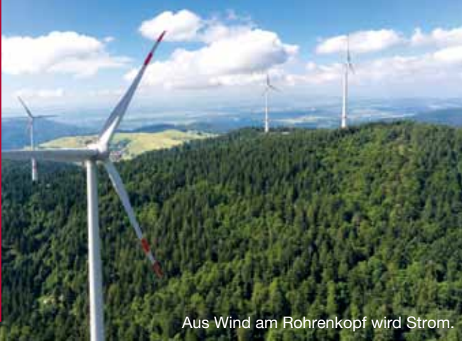
Aus Wind am Rohrenkopf wird Strom.