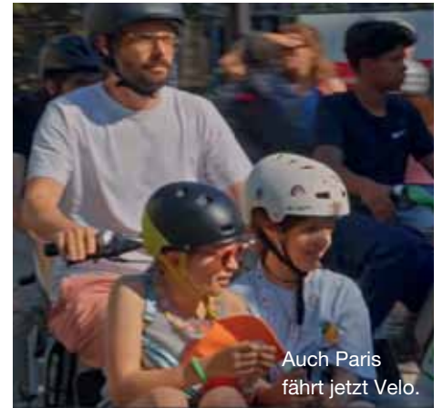
Auch Paris fährt jetzt Velo.

Die 90 Minuten lange Dokumentation ist frei verfügbar über Youtube. Die zur Finanzierung nötige Werbung nimmt man wohl oder übel in Kauf und klickt sich voran. (wg)