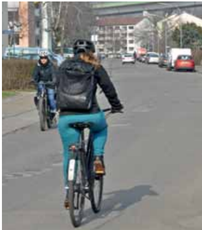
Die Hartmattenstraße wird erneuert und danach eine Fahrradstraße sein.

Im Sommer 2020 hatte Lörrachs Stadtverwaltung ihre „Fahrradstrategie 2025+“ vorgelegt. Jüngst im November, vor den Stadträten im AUT, prä-