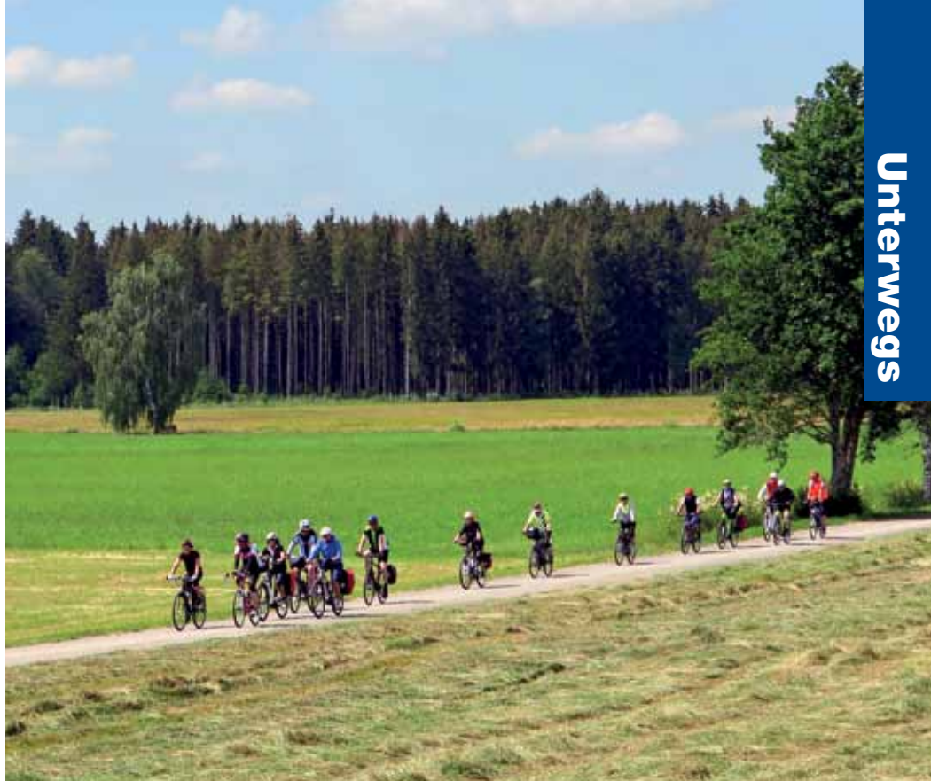
Gemeinsam auf Tour mit der IG Velo Weil – es sind Jahr für Jahr äußerst beliebte Angebote.

Mit dem Fahrrad geht's Richtung Bruderholz Reinach zur Ruine Pfeffingen bei Aesch. Sie steht auf dem Grat des Blauen. Es sind die Reste einer Höhenburganlage mit einst imposantem Schloss, Hauptsitz der Grafen von Thierstein-Pfeffingen. Über Biel-Benken, Bourgfelden, Basel geht es zurück