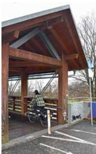
Die Einfahrt kann glatt sein. Jetzt warnen Schilder vor der Gefahr.

Wer bei der Holzbrücke ins Grütt diesen nicht selten rutschigen ersten Meter kennt; und daran auch denkt beim Annähern – der oder die kann einem Sturz vorbeugen: die Kurve zur Brücke noch auf dem Asphalt zu Ende fahren, danach geradeaus weiter auf die Holzdielen. (wg)