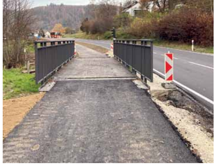
Ein kurzes Stück vor Maulburg fahren Radler auf dieser neuen Brücke über den Talmattenbach.