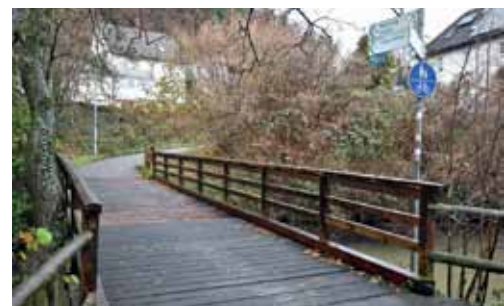
In Haagen hat's auch diese Brücke über den Kanal in sich, bei Regen und Frost. Sie wird nächstes Jahr saniert mit rutschfestem Belag.