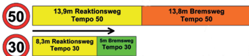
Ob Autofahrer mit 50 oder 30 unterwegs sind, macht bei Vollbremsung großen Unterschied: rund 28 Meter bis zum Halt oder nur 13 Meter. Grafik: VCD Bayern

Flächig Tempo 30 wäre ein entscheidender Schritt, um „Vision Zero“, das heißt keine Toten im Straßenverkehr, näher zu kommen. Dass dies möglich ist, zeigt die finnische Hauptstadt Helsinki mit ihren fast 700.000 Einwohnern. Nach langjährigen systematischen Bemühungen und Investitionen