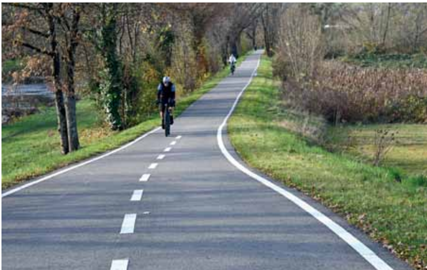
Wie lassen sich auf dem Wieseweg Radfahrer und Fußgänger trennen? Es braucht eine gute Strategie, gesucht zunächst für den Abschnitt Haagen-Tumringen.

tegie entwickelt werden, wie im gut zwei Kilometer langen Abschnitt von Haagen bis Tumringen die Radfahrer von den Fußgängern getrennt werden können. Zuschüsse für Planung und Bau sind aus dem Agglomerationsprogramm Basel zu erwarten und ebenso vom Land Baden-Württemberg. (wg)