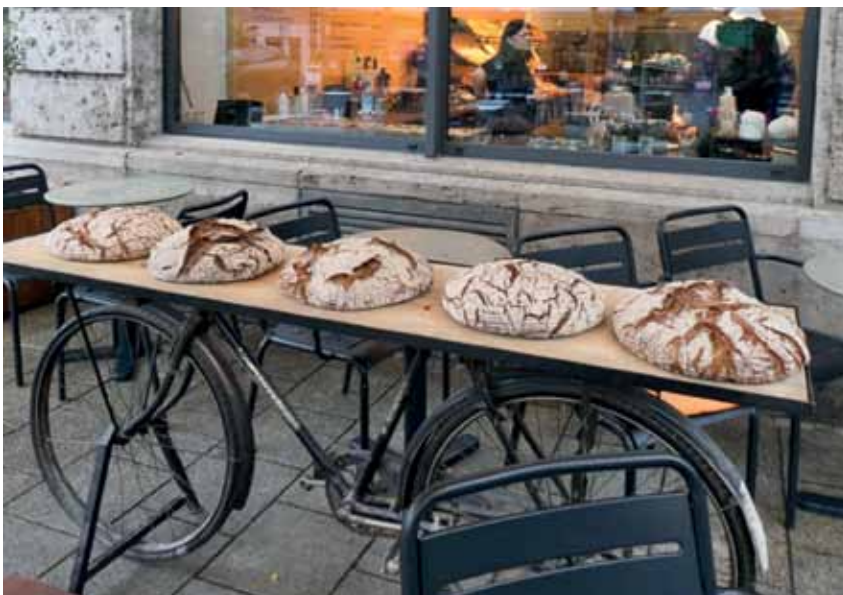
Laib an Laib. Vor einer Bäckerei in Augsburg ein altes Velo zum Brotständer umgewandelt. Ein Hingucker.

Auf ein Neues! Zu unserer großen Freude halten VeloPost-Leser gerne Ausschau nach Schönerem, Kurioserem oder Witzigerem für unsere Mitbringssel-Seiten! Vielen Dank dafür, wieder einmal. Sie fotografierten in Deutschland, Frankreich, Österreich und der Schweiz. Gerne weiter so! In der nächsten Ausgabe, im Frühjahr, halten wir selbstverständlich erneut Platz frei. Fotos bitte schicken an die Adresse velopost@igvelo.de .