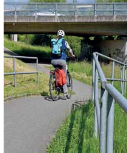
Begradigt und verbreitert wird die Unterführung an der Wiese beim Bauhaus.