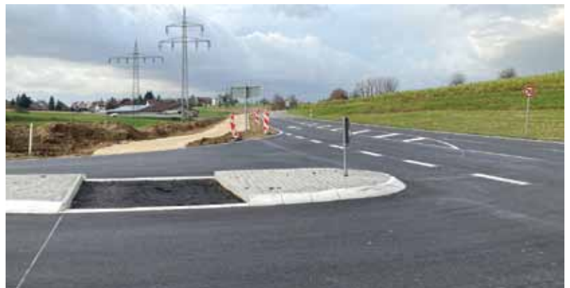
Der Radweg endet vorerst hier, südlich von Adelhausen, wo die Landesstraße von Norden (oben) kommt und nach Westen (links) abschwengt. Radler werden über diese Mittelinsel queren, um auf der Radroute zu bleiben – die wird gerade aus weiterführen, entlang der Kreisstraße (nach rechts) Richtung Minseln.