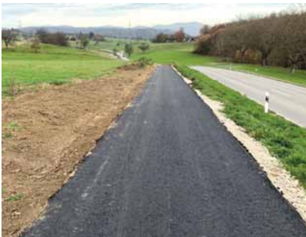
Hinunter Richtung Maulburg entlang der L 139. Es fehlte bei der Probefahrt nur noch der feine Asphalt obenauf.

Wenn auch der Weg nach Minseln fertig ist, werden Radfahrer über eine durchgehende und sichere Querung des Dinkelbergs verfügen. Hochrhein und Wiesental werden erstmals über Radwege verbunden sein. (gz)