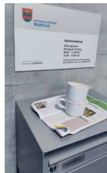
Begegnungen, Aufmerksamkeiten. Wie die zwei Tassen Kaffee zum Frühstück vom Hausmeister einer Schule in Wartau.

Nach vielen netten Begegnungen und einem Austausch über bereits gefahrene und noch zu fahrende Strecken, führte uns die schmale, anfangs steile Straße abwärts, vorbei an der Rosenloui-Schlucht und weiter bis Innertkirchen. Wo wir an der stark befahrenen Kreuzung vor einem Supermarkt eine kurze Verpflegungspause einlegten. Im Gespräch mit anderen Radreisenden entschieden wir uns für die nächste Herausforderung, den Sustenpass. Obwohl ich bezweifelte, dass ich den Pass vor Sonnenuntergang bewältigen könnte. Die Hitze drückte mir bei jeder Anstrengung die eben runtergekippte Flüssigkeit gleich wieder aus allen Poren. Jede Möglichkeit, den Kopf und den Oberkörper unter einen Wasserstrahl zu halten, nutzen wir ausgiebig.