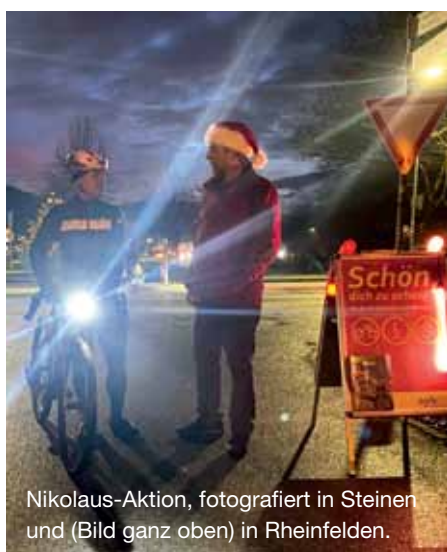
Nikolaus-Aktion, fotografiert in Steinen und (Bild ganz oben) in Rheinfelden.

Mit einer Nikolaus-Aktion haben sich im Landkreis Lörrach einige Kommunen bei jenen Menschen bedankt, die auch in der dunklen, kalten Jahreszeit auf dem Rad unterwegs sind: eine Aktion, die von der Arbeitsgemeinschaft Fahrrad- und Fußverkehrsfreundlicher Kommunen (AGFK) ins Leben gerufen worden war. Das Team Radverkehr im Landratsamt hatte hier im Landkreis Lörrach die Initiative ergriffen, in der IG Velo und Kommunen Partner gefunden und rund um den Nikolaustag für kleine Präsentate gesorgt – verteilt an Radrouten in Lörrach, Rheinfelden und Grenzach-Wyhlen, Weil am Rhein, Schopfheim und Steinen. Geachtet wurde auf richtige Beleuchtung. Von der IG Velo gab es eine Postkarte mit verständlichem Bild: Wie Scheinwerfer so eingestellt werden, dass sie andere nicht blenden. (wg)