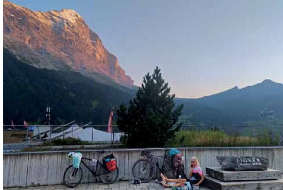
Grindelwald: übernachten vor dem Eiger, selbstverständlich draußen; und anderntags Weiterfahrt hinauf zur Großen Scheidegg.