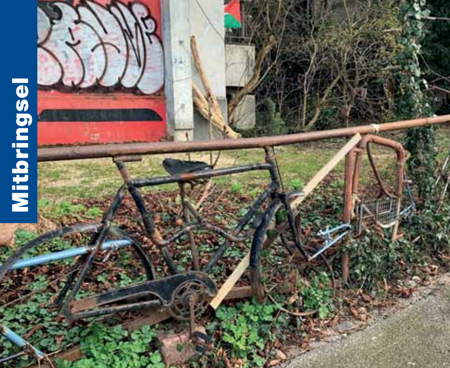
Wiederverwendet. Auch ausgemusterte Velos sind noch nützlich. Hier sind sie zu einer Absperrung verschweißt – gesehen von Yvonne Siemann im Basler Klybeck-Quartier.