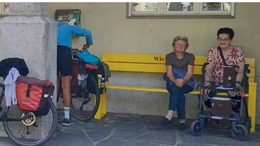
Immer nette Leute, Schwätzchen: Halt an einem Seniorenheim im Reusstal.

Alles in allem: Wir haben pro Tag und Person ca. 30 Franken ausgegeben, viele nette Menschen kennengelernt, schlechte Stimmungen und Widerstände überwunden, Freiheit gespürt und die Schweizer Sauberkeit und Infrastruktur schätzen gelernt.