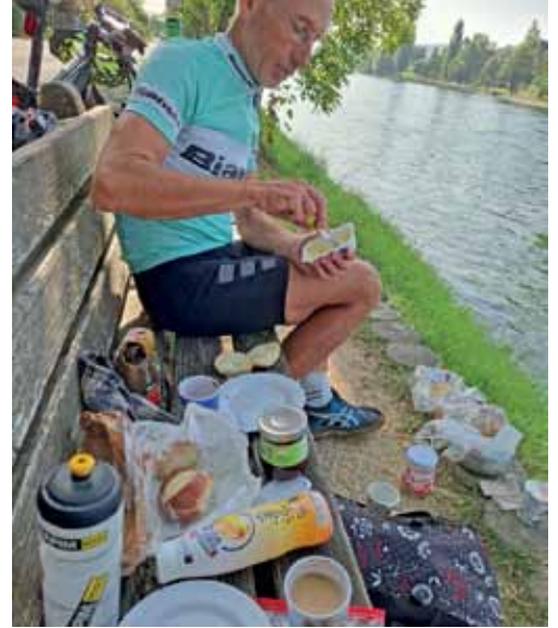
Noch zwei letzte Etappen nach Hause, mit Aufwachen an einer Kaimauer am Bodensee und Essenspause am Hochrhein.

die Schmerzen in meiner vor einem Jahr gebrochenen Schulter und wegen dem üblichen, leidigen Sattelthema sich bemerkbar machten. Durst, kein Brunnen in Sicht, und unser Trinkwasservorrat schmolz dahin. Das Besprühen meiner durch Salz brennenden Augen musste ich mir absparen. Und da stand doch plötzlich, in einer kleinen Ausweichstelle, mein konditionsstarker, vorausfahrender Partner neben einem Kleinbus mit einer muslimischen Großfamilie – sie wollte uns unbedingt einladen. Wir nahmen dankbar je eine Banane und ein kleine Flasche Mineralwasser zu uns. Und weiter auf die letzten vier Kilometer! Stolz, im Anblick der letzten Sonnenstrahlen, erreichten wir die Passhöhe.