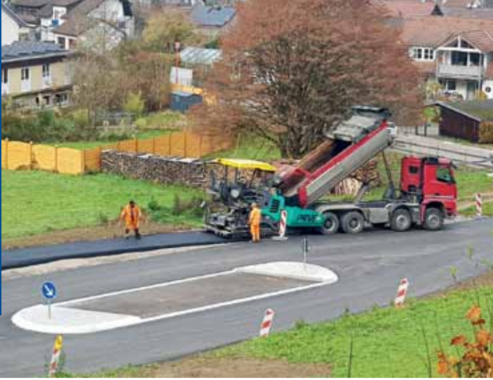
Vor der Ortseinfahrt Maulburg ist fürs Radfahren eine Mittelinsel angelegt, als Hilfe für sicheres Queren – hier ein Foto vom Bauen.