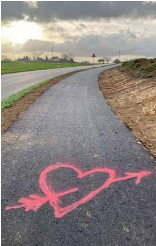
Schon vor Fertigstellung des Radwegs hat jemand die Liebe zu ihm bekundet – das Herz wird leider unter der finalen Deckschicht verschwinden.