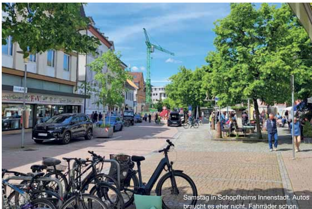
Samstag in Schopfheims Innenstadt. Autos braucht es eher nicht, Fahrräder schon.

So blieben auch die Parkplätze vor dem Unverpackt-Laden frei, die durch Demontage der Velobügel wieder verfügbar waren – zumindest während des Beobachtungszeitraums bis Mittag. Einzelne freie Parkplätze gab es zu jeder Zeit in der