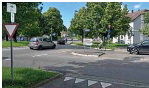
Und so (vorne bei den Haifischzähnen) kommt man am Kreisel an. Könnte man Radler hier besser in den Kreisel einführen?