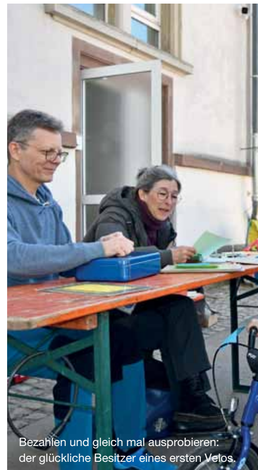
Bezahlen und gleich mal ausprobieren: der glückliche Besitzer eines ersten Velos.