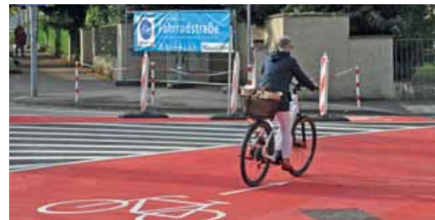
Lörrach schnitt am besten ab, erntete aber auch deutliche Kritik – so an der Fahrradstraße.

Auch in Grenzach-Wyhlen wäre es lohnend, im Rathaus würde man sich die Anmerkungen der Tester anschauen – manch einer schildert bis in die Verästelungen hinein, welche Macken diese oder jene Radroute hat. Ein wich-