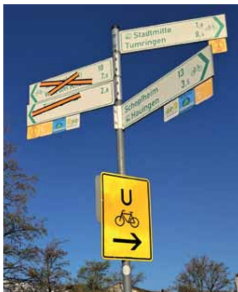
Die Baustelle frühzeitig angekündigt, eine Umleitung ausgewiesen – lückenhaft, klagten manche .