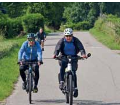
Die Mühlenstraße soll Fahrradstraße werden, erst auf Rümmingen zu (oben), dann innerhalb Binzens (unten).

Ein Stück weiter Richtung Dreispitz folgt ein nächstes Ärgernis für Radfahrer: der enge und unübersichtliche