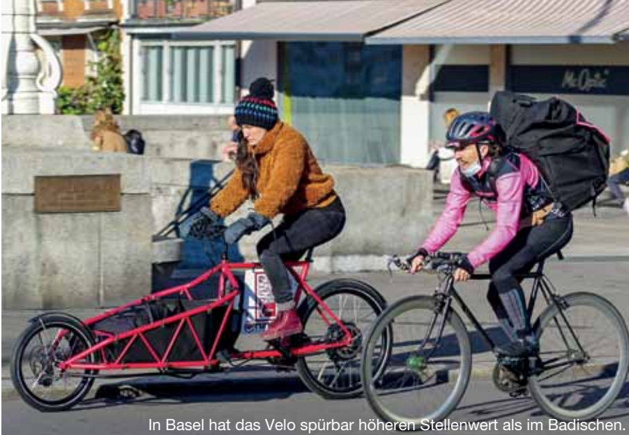
In Basel hat das Velo spürbar höheren Stellenwert als im Badischen.

Verlierer aber gibt es offenbar nicht. Die Baslerinnen und Basler stimmten wieder einmal fürs Radfahren – nur eben nicht ganz so überschwänglich.