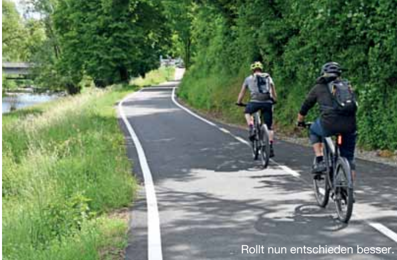
Rollt nun entschieden besser.

Lörrach hat oberhalb der Tüllinger Brücke einen nächsten Abschnitt des Wiesewegs (Pendlerroute West) saniert – die IG Velo hatte darauf gedrängt, denn das Wegstück war zur Holperstrecke geworden. Auf 140 Metern Länge ist der Weg frisch asphaltiert und bei der Gelegenheit auch etwas verbreitert worden: von 2,80 Metern auf 3,30 bis 3,40 Meter. Wofür ein direkt am Wegrand gelegenes Schachtbauwerk umgebaut werden musste. Abgerechnet war die Maßnahme bis Redaktionsschluss noch nicht. Die Stadt rechnet mit 30 bis 40 Prozent Zuschuss aus dem Agglomerationsprogramm Basel. (wg)