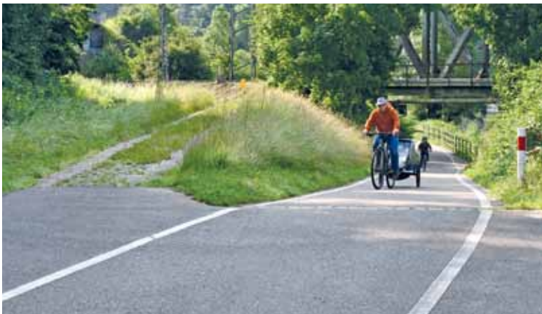
Der Wieseradweg wird hier (links im Bild), vor der Bahnbrücke, mit dem Campus Zentralklinikum verknüpft – auf Asphalt.

Auf jeden Fall brauchen Radfahrer rechtzeitig zur Kliniköffnung praktikable Zufahrten. Wie der Campus von Lörrach her erreicht werden kann, hat die IG Velo bereits im Rathaus diskutieren können. Ab Ortsende Hauingen, an der Steinenstraße, wird die Lücke bis zum schon fertigen Rad-/Fußweg neben der Straße geschlossen. Aber der Wieseweg wird der meist benutzte Zubringer sein. Flussaufwärts fahrend zweigt vor der Bahnbrücke ein Weg links ab und kann asphaltiert bis Höhe Zentralklinikum reichen. Und wird weitergeführt zum geplanten Parkhaus des Klinikums, darin auch 400 Stellplätze für Fahrräder. Auf den Plänen scheine die Zufahrt zum Parkhaus für Radverkehr nicht gut und sicher genug, kritisierte Wolfram Uhl bei der Info-Veranstaltung. (wg)