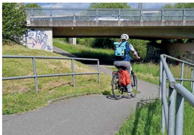
Diese Passage am Wieseweg bei Haagen kann entschärft werden. Für eine Begradigung und Verbreiterung ist noch Platz da.

Ein kurzes Stück weiter, beim Bauhaus, wird das Radfahren auf dem Wieseweg etwas knifflig und manchmal riskant: Es ist die mit Geländern gesäumte Abfahrt zur Unterführung. Die IG Velo hat immer wieder ein Entschärfen gefordert. Das hat auch die Stadtverwaltung im Sinn. Eine etwas