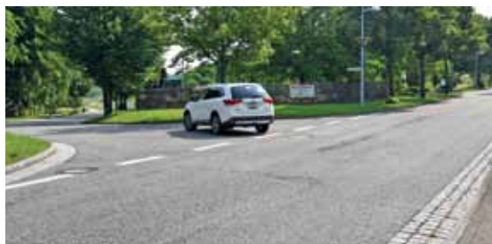
Auf dem Abzweig nach Rümmingen (oben) sollen Radler eine Aufstellfläche erhalten. Im Bild rechts der auszuschildernde Weg hoch zur Lucke. Und darüber die enge Unterführung am Dreispitz: Ein breiterer Neubau ist nicht realistisch; aber Radfahrer sollen nachdrücklich zu Vorsicht ermahnt werden.