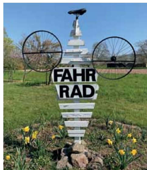
Willkommene Werbung. Steht in einem Garten in Eimeldingen, von Binzen her am Ortseingang. Selbst gebaut aus Blumenkisten – und hoffentlich wirksam!