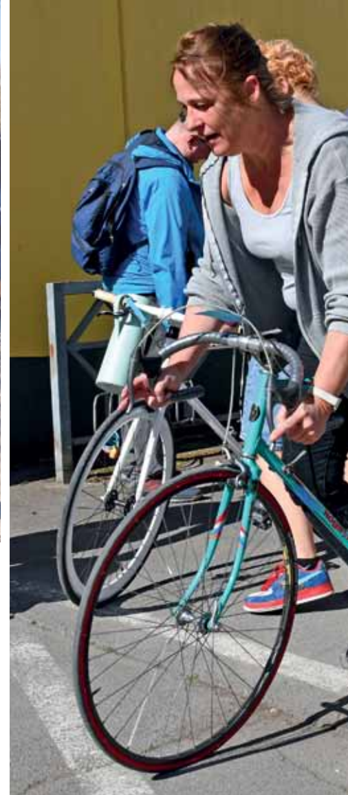
Cooler Renner – aber fährt er sich auch gut?

Am 12. April schloss die IG Velo Lörrach die Börsen-Saison 2025 ab, an jenem Samstag, der in die Osterferien hineinführte – vielleicht brachten deshalb weniger Leute als gewohnt ihre nicht mehr genutzten Fahrräder zur Börse. Genau 141 standen schließlich auf dem Hof der Hebelschule. Davon 89 fanden neue Eigentümer, immerhin 63 Prozent. Zwei Dutzend Helfer hatte die IG Velo Lörrach aufgeboden, die ordentlich zu tun hatten und so gut gelaunt waren wie die allermeisten Kunden – von denen viele ausdrücklich Danke sagten für diesen Service. Übrigens: In Lörrach gibt es die Velobörse bereits seit 1989. (wg/kdg/gz)