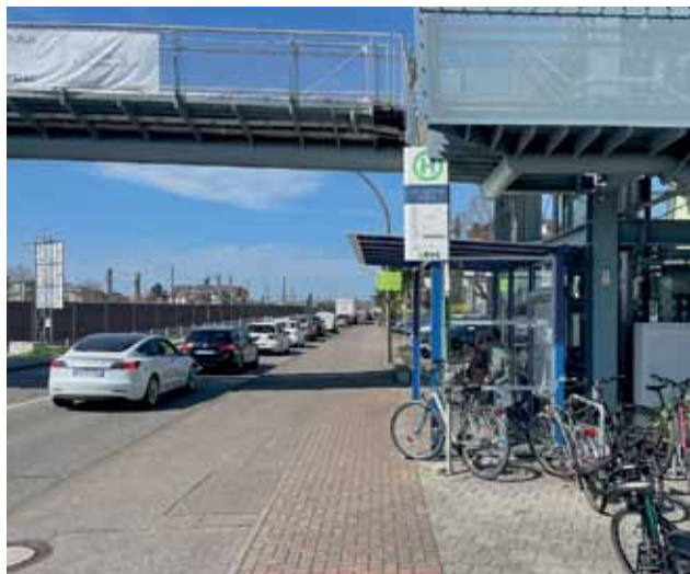
Recht breit und doch zu eng: Rad- und Fußweg an der B 3.

Die IG Velo bat darum, mit dem zuständigen Regierungspräsidium eine