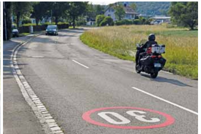
Ab Ortsende Hauingen braucht es noch eine Verbindung zum schon fertigen Weg ums Klinikum herum. Klappt wohl rechtzeitig.