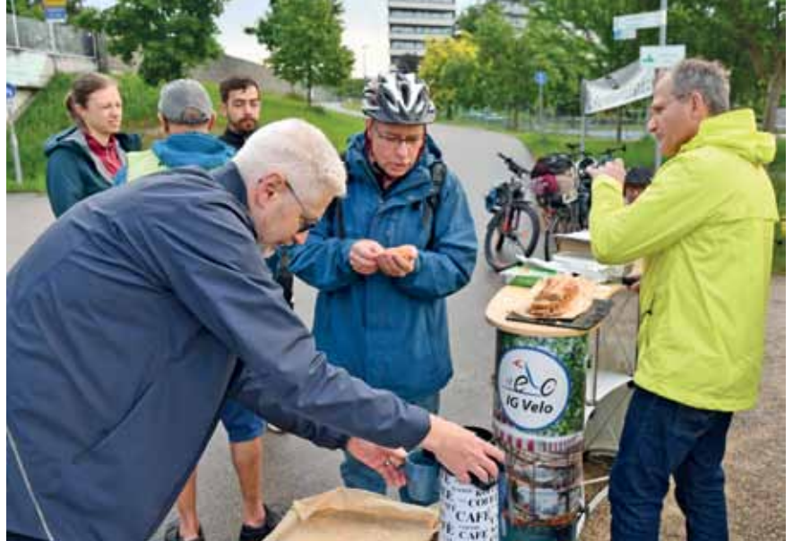
Kurzer Halt beim Pendlerfrühstück vor der Schweizer Grenze.