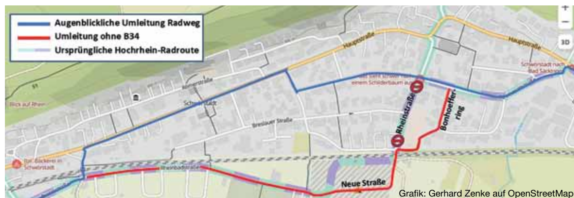
Grafik: Gerhard Zenke auf OpenStreetMap

Bald könnte die Rheinbadstraße (unten in Rot) fertig sein und die Umleitung über die Bundesstraße ablösen. Die weiterhin gesperrte Rheinstraße kann über den Bonhoeffering umfahren werden.