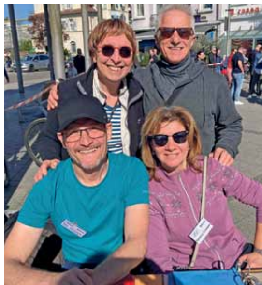
Spaß hatten auch Helfer, hier in Rheinfelden.