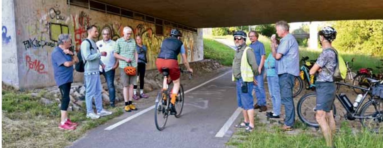
Ebenfalls im Blick der IG Velo: Die Unterführung des B 317-Zubringers in Haagen. Sie könnte verbreitert werden.