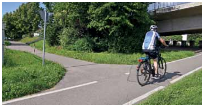
Vom Wieseradweg auf direktem Weg in Haagens Mitte – hier im Bild geht's dafür links ab zum Kreisel. Beschildert ist das schon.

direktere Linie ist möglich sowie ein Verbreitern der Fahrbahn. Ob nach dieser Unterführung des B 317-Zubringers der Radweg nicht unten bleiben könnte? Also gleich noch unter dem Wiesesteg hindurchführen könnte? Wäre genauer anzuschauen. Für die IG Velo ist noch wichtiger, die Wiesebrücke von Hauingen auf dem Rad unterfahren zu können. (wg)