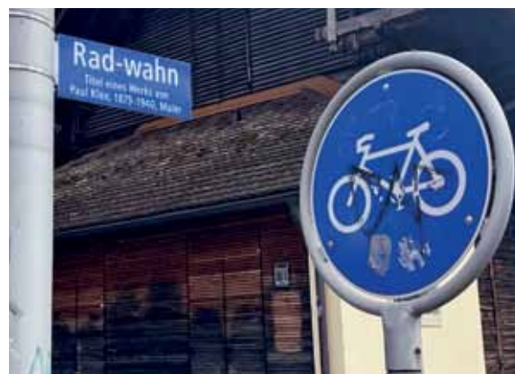
Bei Paul Klee vorbei. „Rad-wahn“ heißt eine Fahrradstraße, die in Bern am Zentrum Paul Klee vorbeiführt – benannt nach einer Bleistiftzeichnung des Malers von 1939, dem Jahr vor seinem Tod.