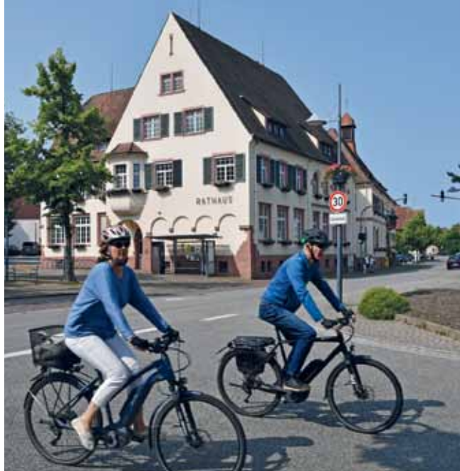
Binzen wird gerichtet für Radfahrer, auch der Umwelt zuliebe.

Tunnel unter der Auffahrt zur Autobahn A 98. Ein Neubau mit großzügigerer Dimension ist nicht realistisch. Bessere Spiegel sollen installiert sowie auf den Asphalt taktile Elemente geklebt werden: Am Lenker soll man's spüren, fährt man nicht ganz rechts in die Unterführung hinunter.