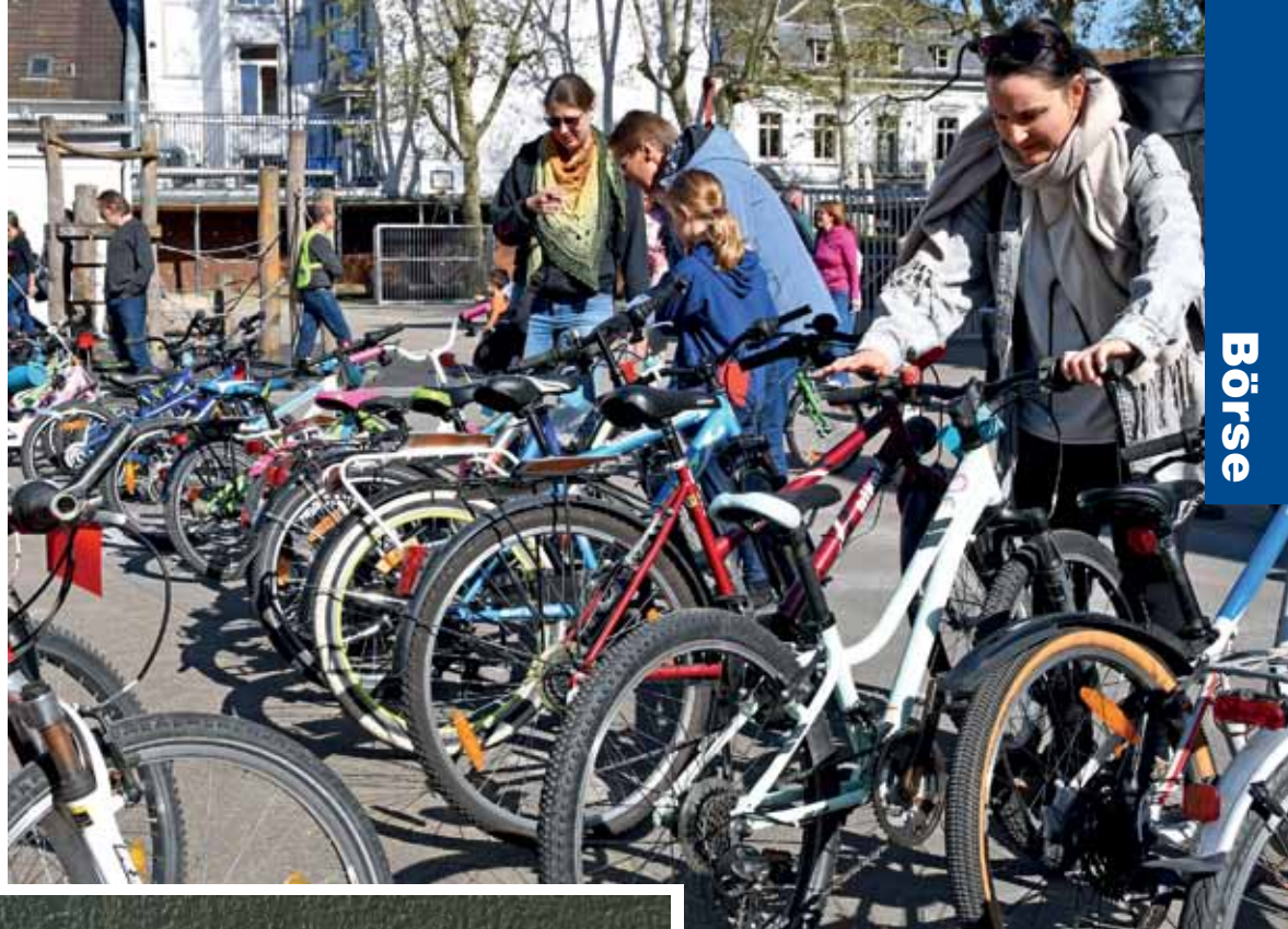
141 Velos hatte die Lörracher Börse zu bieten.