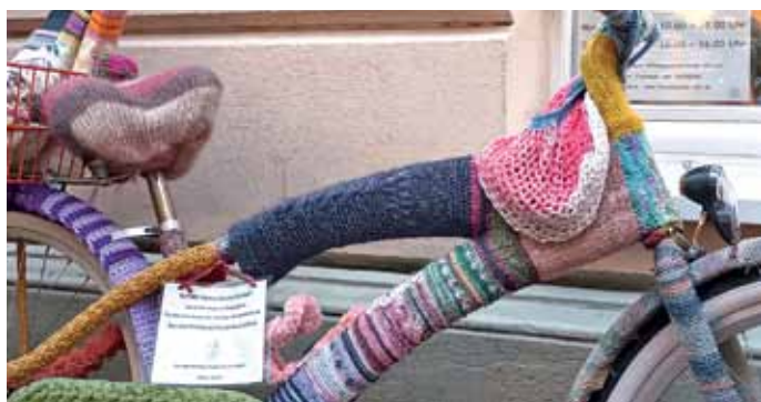
Umgarn. Lübecker lieben ihre Velos – jedenfalls war dies der Eindruck unserer Fotografin Gabriele Hansen bei einem Besuch in der Hansestadt.