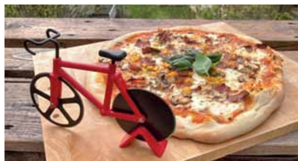
Flotte Sache. Auf dem Velo durch die Pizza! Den außergewöhnlichen Pizzaschneider sah David von Känel bei einem Patenkind in der Schweiz.