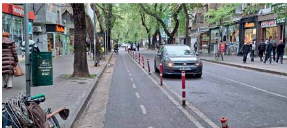
Ein Auge auf Albanien. Christiane Cyperrek hat der VeloPost einen Gruß aus Albanien geschickt. Die Nachfrage nach Mercedes („Noch nie so viele gesehen ...“) sei zwar eindeutig größer als nach Velos, Radwege seien rar. Aber in Tirana – unser Foto – hat sie erkannt: In der Hauptstadt werden Radlern hier und da Routen gerichtet.