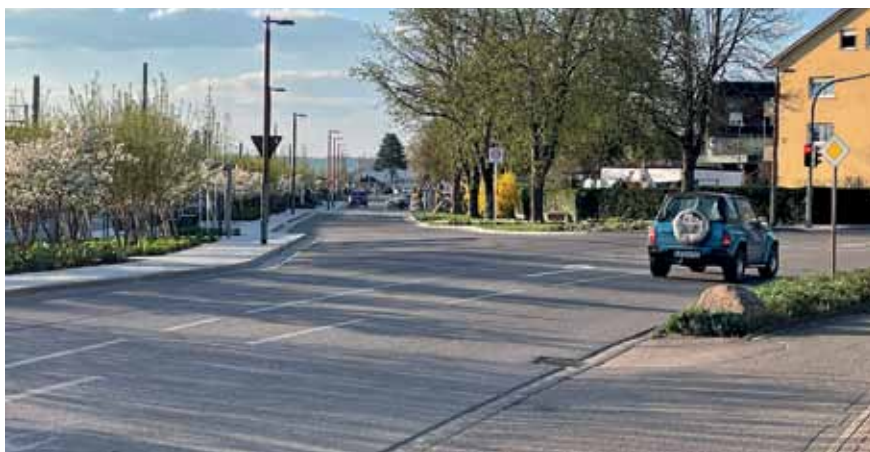
Ungewöhnlich wenig Verkehr: Burgunder-Straße und Freiburger Straße in Haltingen.

Die Vertreter der Stadt hatten ein offenes Ohr für die Probleme, wiesen aber darauf hin, dass Weil am Rhein nicht allein entscheiden könne. Die Stadt sei da unter anderem auch von der Einschätzung des für die B 3 zuständigen Regierungspräsidiums abhängig. (kdg)