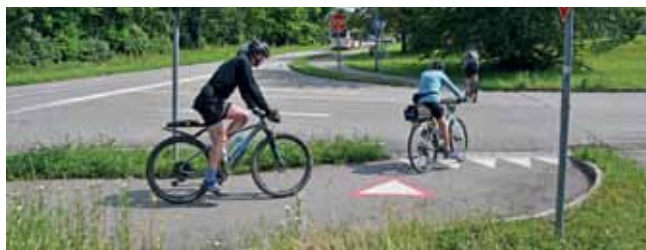
Wenn möglich, sollen Radler bald geradeaus über die Einmündung der A 98-Ausfahrt fahren können. Heute haben Autofahrer ganz vorne einen Platz zum Aufstellen.

Was noch in Binzen? Bessere Radwegweisungen, Abstellanlagen. Und Ideen für nächste größere Verbesserungen: die Blauenstraße als Radachse; eine Freizeit-Route rund um Binzen. Zudem als Vision: eine Fahrrad-Schnelltrasse neben den Schienen der Kandertalbahn. (wg/uh)