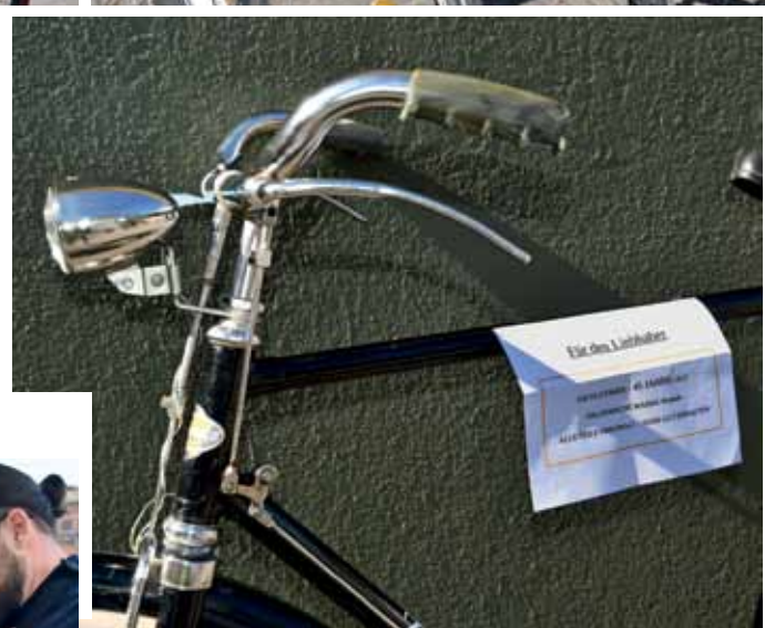
„Für den Liebhaber“. Auch Oldtimer wie dieser waren im Angebot – ein 45 Jahre altes Torpedo-Rad, sämtliche Teile im Original, sehr gut erhalten. War in Lörrach zu kaufen.