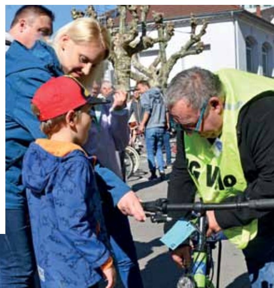
Sattel und Lenker einstellen, Gangschaltung justieren: Die IG Velo bot auch solchen Service.