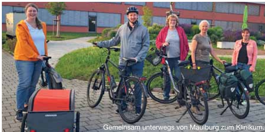
Gemeinsam unterwegs von Maulburg zum Klinikum.

Am Ende gab es noch einen kurzen Ausflug ins Thema Radreisen. Dieser Stammtisch mit den lebhaften Gesprächen machte eindeutig Lust auf mehr. Auch IG Velo-Mitglieder kommen. In Maulburg ist die IG Velo Wiesental in einem sehr guten Austausch mit Bürgermeisterin und Ordnungsamt. (cf)