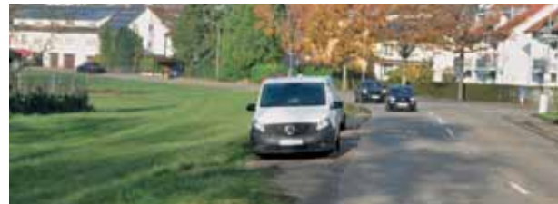
Aus Hauingen heraus wird ein neuer Weg neben die Steinenstraße gelegt.