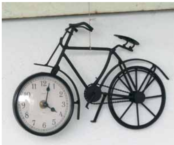
Exakte Zeit. Rad mit Uhr – Ulrich Siemann sah's in einer Fahrradwerkstadt in Koserwo (Ostsee) hängen.