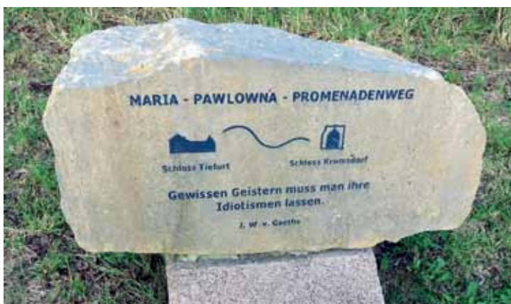
Radeln mit Goethe. Entlang des Ilmtal-Radwegs nahe Weimar gibt es alle 100 Meter einen feinen Satz von Johann Wolfgang von Goethe zu lesen. Ein Muster dafür hier: „Gewissen Geistern muss man ihre Idiotismen lassen.“ auf der Wegstrecke zwischen Schloss Tiefurt und Schloss Kromsdorf.