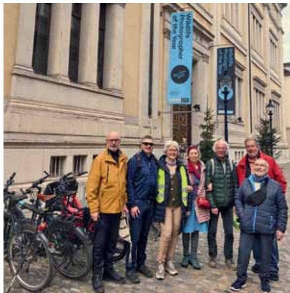
Angekommen vor dem Naturhistorischen Museum.

Die IG Velo Grenzach-Wyhlen fuhr im Januar ihre erste Kultour des Jahres: zum Naturhistorischen Museum in Basel und der Sonderausstellung „Wildlife Photographer of the Year“. Die tollen Fotos und die dahinter steckenden Geschichten bereiteten den Teilnehmenden eine tierische Freude. Als Abschluss, auf der Rückfahrt, kehrte die Truppe gut gelaunt ins Café der Papiermühle ein.