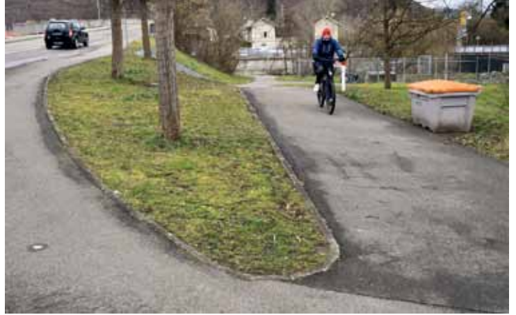
Haagen: neue Route von der Wiese zum Kreisverkehr bekommt Licht.