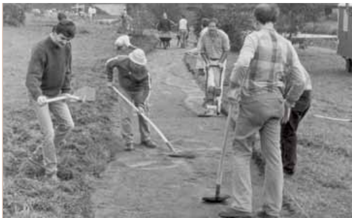
IG Velo-Mitglieder schlossen auch schon selbst eine ärgerliche Lücke im Wieseradweg, Höhe Haagen. Ohne Erlaubnis. 1989 war das.