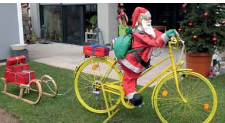
Allrounder. Zunächst erleichterte das gelbe Rad die Anreise des Nikolaus', einige Wochen später machte es Narrenmobil. Ulrich Siemann fotografierte beides in Kandern.

Gerne weiter so! Fotos bitte schicken an die Adresse velopost@igvelo.de