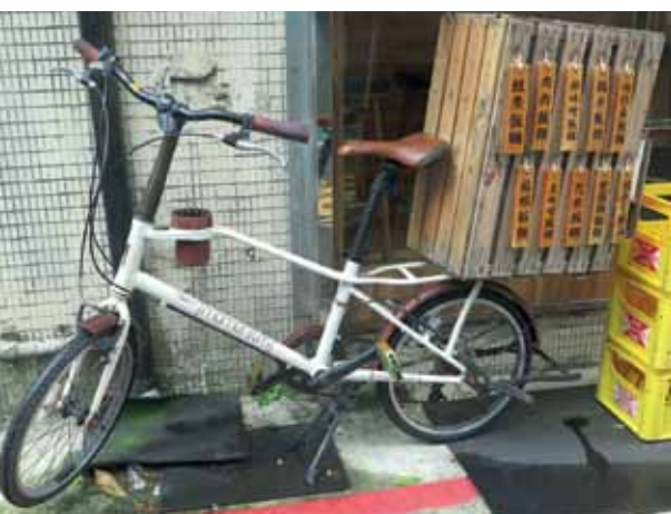
Auf der Holzbox die Speisekarte eines Frühstücksrestaurants in Taipei. Es gibt Reisrollen, unter anderem mit Fleisch oder Fisch gefüllt.

https://www.taiwantourismus.de https://taiwanbike.tw/en