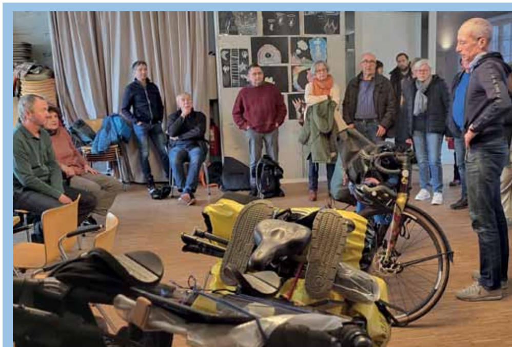
Die IG Velo zeigte, wie gut (und auch unterschiedlich) Reiseradler ihre Fahrräder packen.