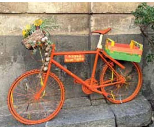
Achtung Pizzeria! Erwin Ruser ist dieses Fahrrad ins Auge gefallen, in Catania auf Sizilien – ein farbiger Hinweis auf die Pizzeria Vecchio Teatro.