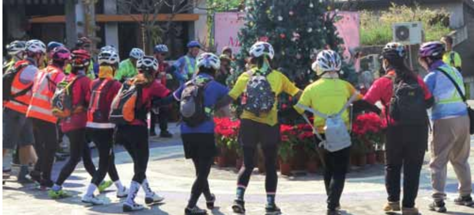
Taiwan hat mehr als ein Dutzend indigene Volksstämme, in der Regel Christen. In großer Überzahl sind Taiwaner chinesischer Herkunft – und die sind hier als Radfahrer bei Aborigines unterwegs und tanzen zur Einstimmung auf die Tour um einen Weihnachtsbaum (es war Januar).