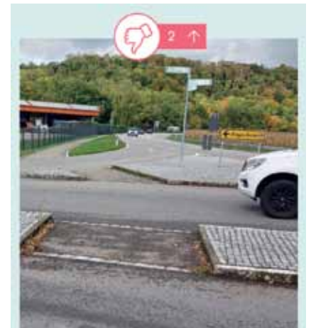
So geht's: Daumen runter in Efringen-Kirchen, ein Spot in bikeable .