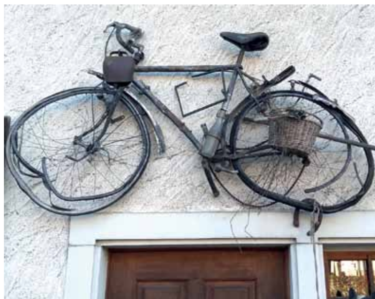
Aufgehängt. Nicht mehr recht fahrtüchtig (aber mit Glocke und Trinkflasche gerüstet), nun an die Fassade gebohrt. Yvonne Siemann schoss das Bild in Ormalingen, Basel-Land.