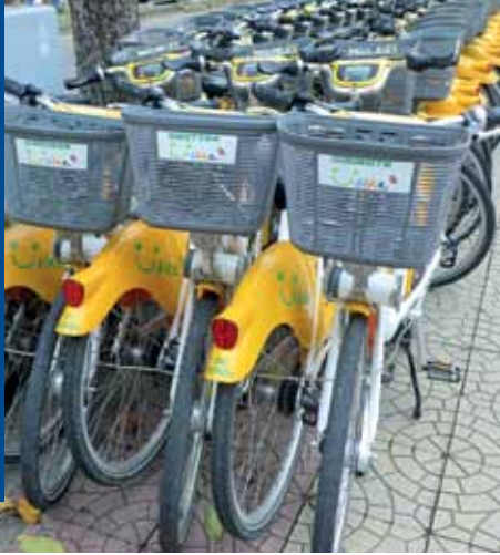
Leihvelos (Youbikes) werden rege genutzt.