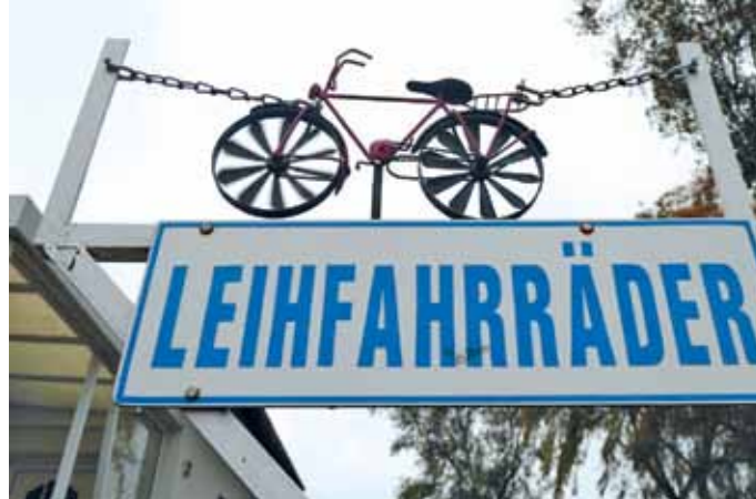
Windstärke 5. Ein gut 70 Jahre alter Fahrradverleiher im Ostseebad Koserow begrüßte Ulrich Siemann sofort mit: „Ich verleihe keine E-Bikes.“ Die waren auch gar nicht gewünscht – aber wären durchaus nützlich gewesen beim Antreten gegen Windstärke 5. Sein Werbeschild mit diesem liebevoll gebauten kleinen Velo hatte als Laufräder Windräder – die drehten sich rasend schnell.