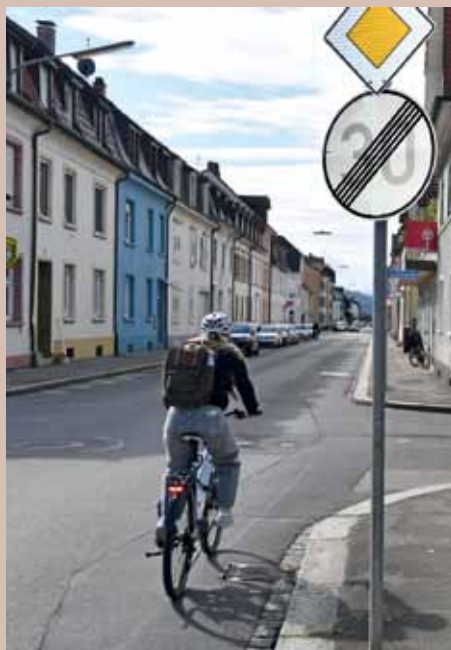
Kreuzstraße: Tempo 30 darf nicht mehr enden.

Die Stadt wird das Wegstück in diesem Jahr ausleuchten. (wg)