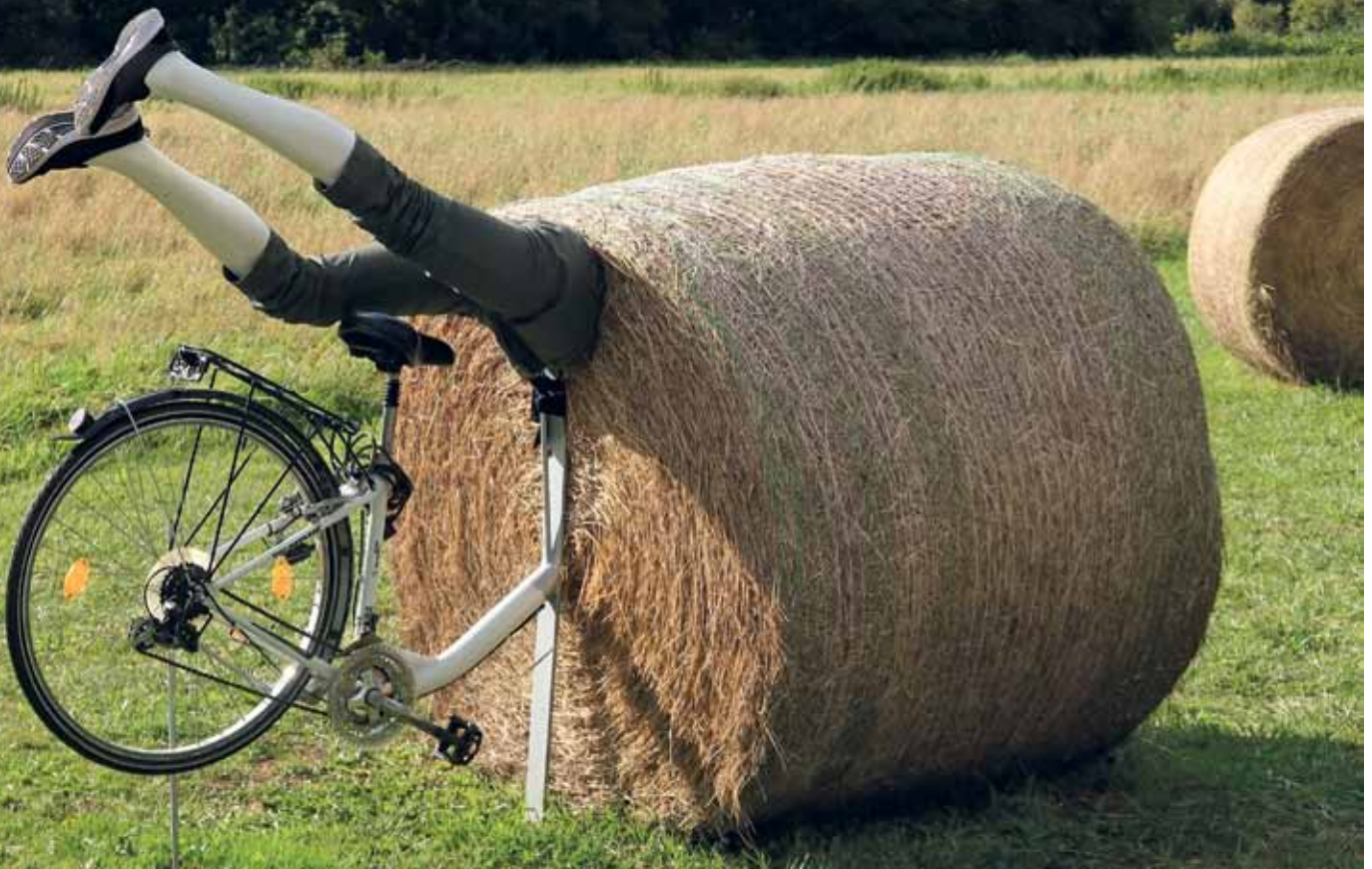
Gutgegangen? Der Aufprall war wohl gedämpft – aber ob's letztlich gut ausgegangen ist, wusste Fotograf Harald Schöne uns nicht zu sagen. Der Unfall ereignete sich in der Nähe von Mülheim an der Mosel.