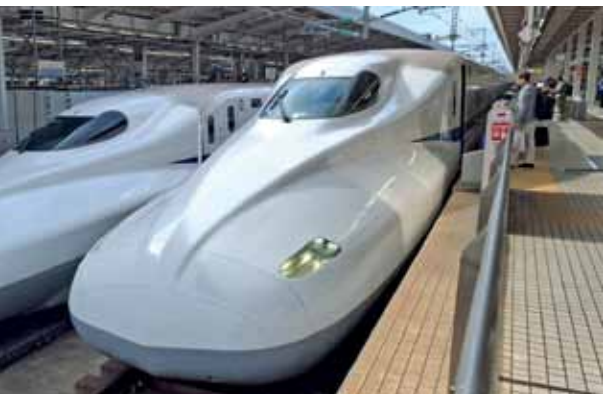
Im Shinkansen schnell zur Radstrecke.

Mit dem schnellen Shinkansen übers Wochenende von Osaka in Richtung Hiroshima, nach Kurashiki: eine historische Stadt in der Präfektur Okayama, die besonders für ihr gut erhaltenes Altstadtviertel bekannt ist. Kurashi-