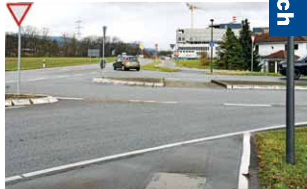
Die Radroute quert diese Kreuzung. Ginge es sicherer?