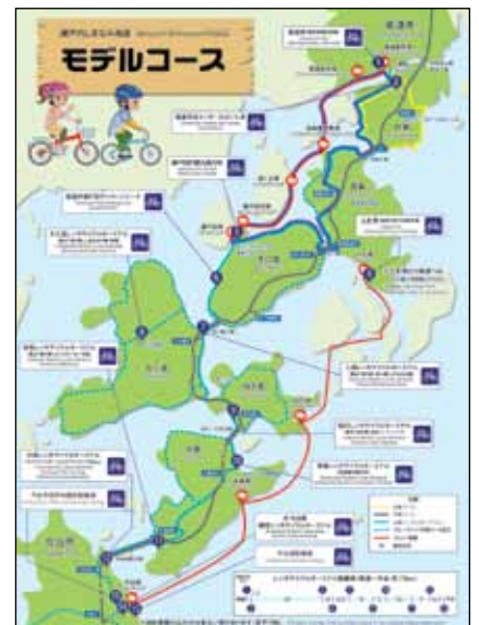
Die Inseln im Seto-Binnenmeer, mit Brücken (und Radroute) erschlossen.

Aber nochmals zurück an den Anfang. Nach einer Woche Arbeit in Tokyo und Osaka (auch wegen Covid war die letzte Reise schon acht Jahre her) war ich doch überrascht, wie sehr sich Japan verändert hat. Überall findet man heute englisch beschriftete Hinweisschilder und Wegweisungen, man kann sich ziemlich selbstständig allein bewegen (auch google-maps und google-translate machen es möglich). Touristen in beachtlicher Zahl (auffällig viele Schweizer und Deutsche) nutzen den aktuell schwachen Yen; und auch Tax-free-shopping sorgt für einen aktuellen Touri-Boom, vor allem