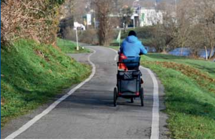
Ein weiteres Stück Wiese-Radweg wird erneuert.