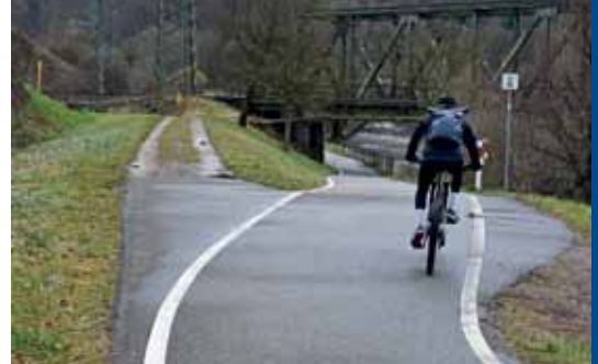
Zum Klinikum wird's hier links abgehen.

Steinen und die IG Velo Wiesental wünschen auch eine Anbindung vom Steinenbach her, über einen ausgebauten Feldweg. (wg)