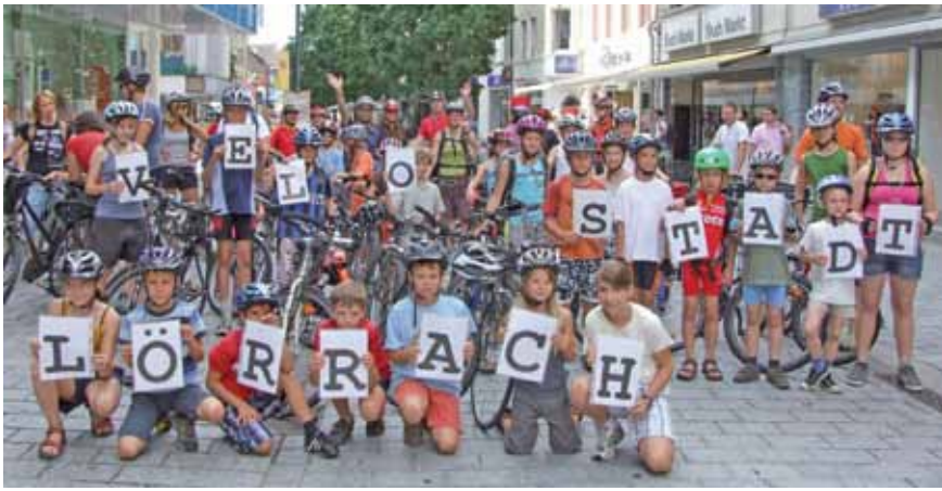
Werbefoto. Vor dem Start zur Familientour 2010 gruppieren sich die jungen Teilnehmer erst einmal zu dieser Werbung für die VeloStadt Lörrach.