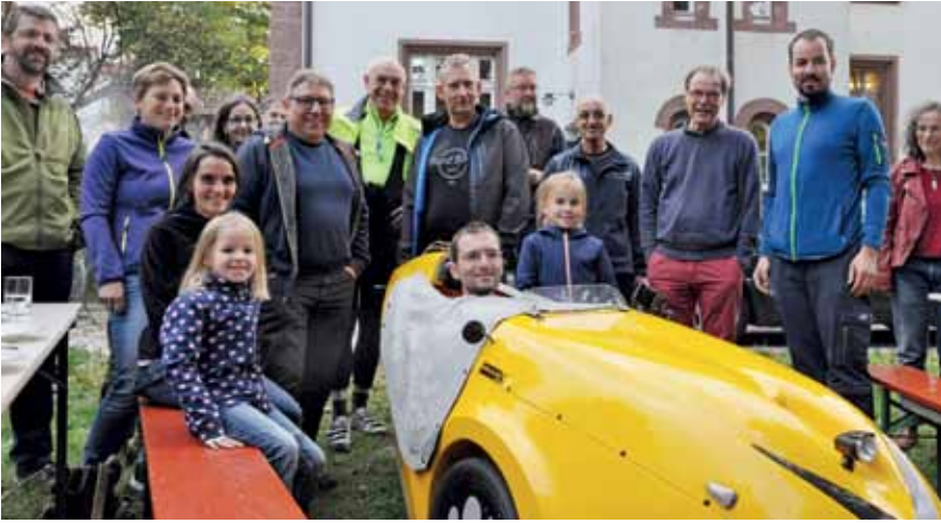
Willkommen beim Velo-Fest. In Lörrach lädt die IG Velo Mitglieder und andere Radler zum Grillen und Feiern ein, im Frühling 2018 im Garten des Nellie Nashorn – woraus eine feste Einrichtung werden soll.