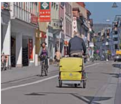
Zuwachs in Lörrach. In der Verkehrskommission IVK hat die IG Velo diese Neuerungen in Lörrach mit vorbereitet: Die Fußgängerzone wird 2010 in der Turminger Straße (unser Foto) und ebenso in der Turmstraße verlängert, was auch für den Radverkehr ein erfreulicher Gewinn ist.