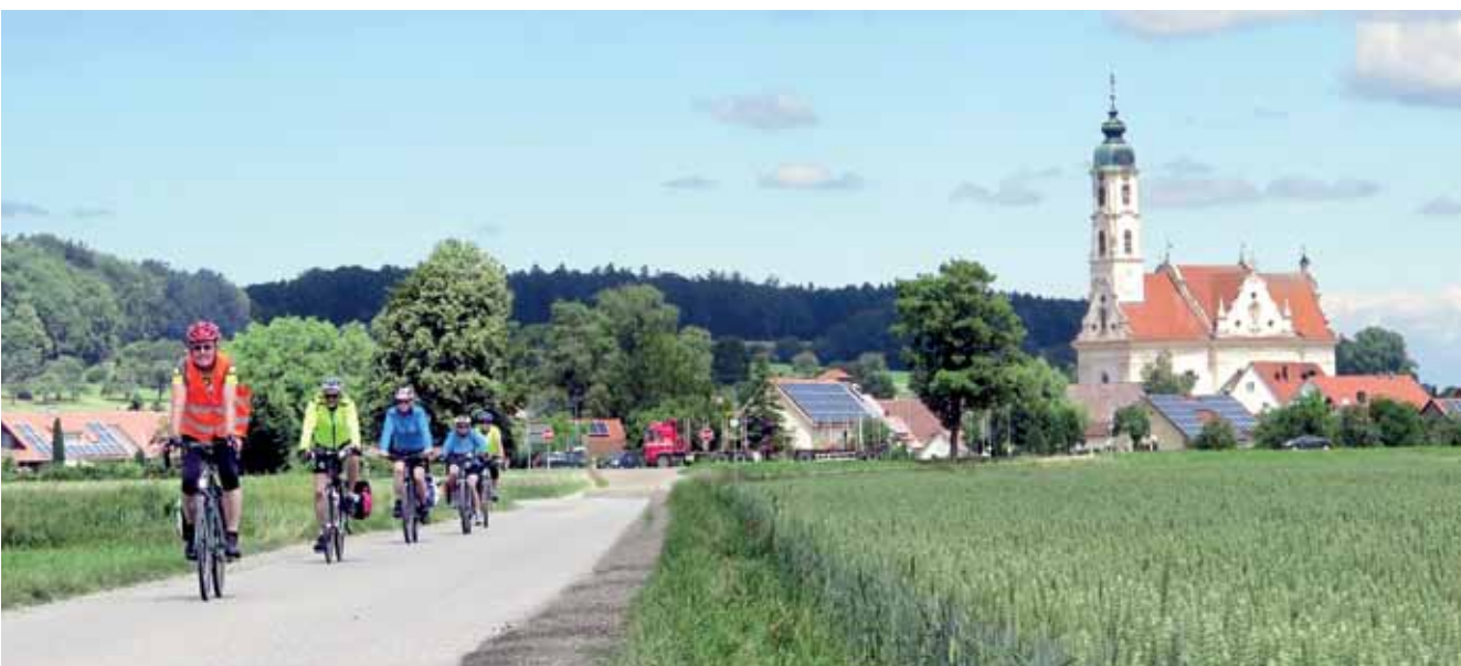
Landschaften erkunden. Die Ortsgruppe Weil am Rhein wird von Radfahrern auch geschätzt für ihre teils mehrtägigen Touren – diese hier hat 2018 durch Oberschwaben geführt und vorbei auch an der Kirche von Steinhausen.