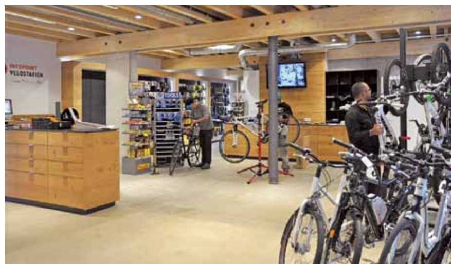
Velö ist offen. Lörrachs Velostation wird im Mai 2012 eingeweiht. Offen ist sie bereits seit Herbst 2011, allerdings noch nicht komplett ausgestattet. Dank einer Kooperation mit follow me und der Sparkasse Lörrach-Rheinfelden hat die Stadt diese zähe Projektgeschichte - sie kostete auch die IG Velo Nerven - doch noch zu einem guten Ende führen können. Velö ist Teil des Neubaus von follow me.