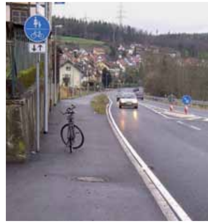
Ertragreicher Herbst. In Rheinfelden freut sich Wolfgang Gorenflo von der IG Velo zum Jahresende 2011 über einige Verbesserungen. Vor allem hat der Radfahrer in Beuggen entlang der B 34 eine attraktive Radroute erhalten (Foto oben).