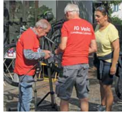
62.000 unterwegs. Im September 2018 scheint die Sonne über dem 12. slowUP Basel-Dreiland. Zum 12. Mal auch ist die IG Velo Weil dabei: Ihre Mechaniker bringen mit einem Pannenservice Räder wieder in die Gänge.