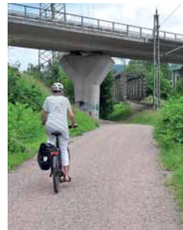
Vom Klinikum zum Wieseradweg: Den Weg gibt es (Foto), der Asphalt kommt noch.

Auch aus Hauingen heraus wird es bis zur Klinikeröffnung eine Radroute geben: ein Neubau, vom Ortsende etwa 300 Meter weit neben die Steinenstraße gelegt bis dahin, wo im Zuge der Neuverlegung der Landesstraße bereits ein Radweg ist. (wg)