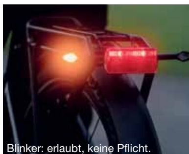
Blinker: erlaubt, keine Pflicht.

kleidung sowie Elemente am Helm sind ebenfalls beliebt und erlaubt. Reflektierende Aufkleber am Rahmen haben keine Zulassung durch die StVZO.