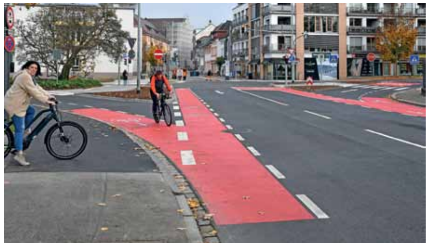
Aus der Weinbrennerstraße (Fahrradstraße!) heraus fädeln sich Radfahrer in die Basler Straße ein – jetzt neu auf Rot, das war der IG Velo wichtig. Der Schutzstreifen bis hierher hätte auch durchgehend rot markiert werden können.

Was selbstverständlich auch Radfahrer freut: Die Magnolie – ein Naturdenkmal – wird weiterhin im Frühling blühen. (wg)