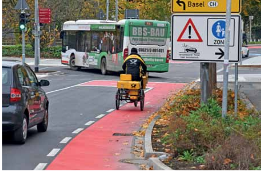
Auf der Baumgartnerstraße an Autos vorbei zur Kreuzung – der Platz war knapp für einen Schutzstreifen, jetzt ist er markiert. Rechts ab will die IG Velo einen Grünen Pfeil.

DRUCK: Druckerei Winter, Heitersheim AUFLAGE: 3.000