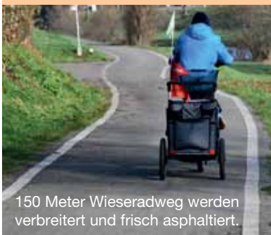
150 Meter Wieseradweg werden verbreitert und frisch asphaltiert.

Was mit dem Geld im neuen Jahr geschehen soll, erläuterten Klaus Dullisch, Lukas Riesterer und Bettina Gropp (alle Fachbereich Tiefbau) im Dezember bei einem Treffen mit der IG Velo. Vor der Grenze nach Riehen wird der Straßenraum neu geordnet; in diesem Zug erhalten Radfahrer einen Schutzstreifen. An der Wiese wird ein rund 150 Meter langes Wegstück frisch asphaltiert und verbreitert: