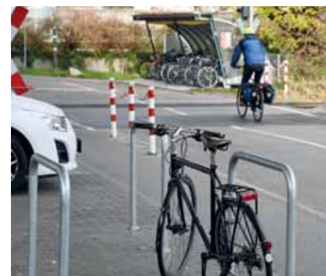
Parkieren beidseits der Schranken.

Lörrach hat am Bahnhof Haagen/Messe für Bike+Ride investiert, fürs Kombinieren von Rad und Bahn. Die überdachte bisherige Abstellfläche hat einen gepflasterten Boden erhalten und Bügel zum Anschließen von 16 Rädern. Neu können auch auf der anderen Seite der Schranken Velos parkiert werden ( vorne im Bild ), unter der Straßenbrücke: Bügel für ebenfalls 16 Velos sind hier installiert, vor Regen geschützt und beleuchtet. Lörrach hat für die Investition Zuschüsse aus dem Pendlerfonds des Agglomerations-Programms Basel erhalten. (wg)