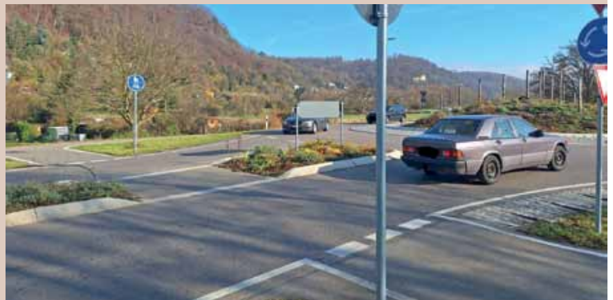
Autofahrer sehen beim Kreiselfahren erst spät diese Querung für Radfahrer.

Das Problem: Die etwa fünf Meter vom Kreisel entfernte Querungshilfe für Radfahrer und Fußgänger ist