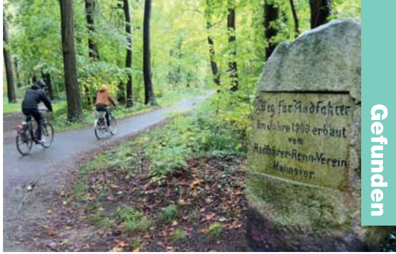
Anno 1900. In Hannover sah Ulrich Siemann diesen Gedenkstein: Der Radfahrer-Renn-Verein hatte dort im Jahr 1900 einen eigenen Weg für Radfahrer gebaut – separat, damit die Pferde nicht scheu werden. Den Weg gibt's noch heute.