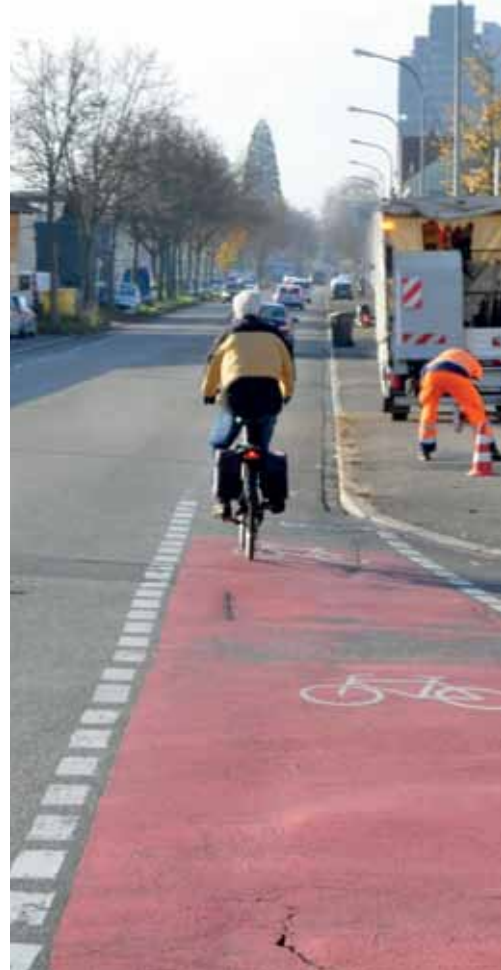
In der Schwarzwaldstraße erhält der Radverkehr bald mehr Raum.

Am Aicheleknotten bekommen Radler rote Wege und Aufstellfläche.