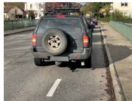
Konflikte (3): Schutzstreifen sind zugestellt, weshalb Radfahrer links an den stehenden Autos vorbeifahren und damit die Konflikte auf der Brücke zusätzlich verschärft werden.