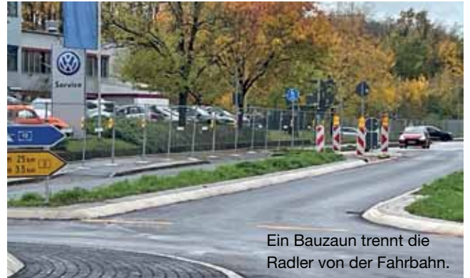
Ein Bauzaun trennt die Radler von der Fahrbahn.

Ordnungsgerecht konnte man daher bisher diesen Bereich nur so nutzen, dass man im Bereich des Kreisels zum Fußgänger wird und sein Fahrrad schiebt oder noch vor der Behelfsausfahrt der Autobahn in den fließenden Verkehr ein- und ausfährt. Eine höchst gefährliche Situation, die wenig Verständnis und Berücksichtigung des Radverkehrs auf Seiten der zuständigen Stellen bei Kreisverwaltung und Regierungspräsidium offenbaren. (kdg)