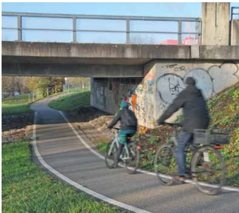
Die Unterführung beim Bauhaus wird umgestaltet.