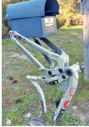
Neu verwertet. War mal ein Velorahmen, jetzt hält er einen Briefkasten. Almut und Klaus Stoll fotografierten am Stadtrand von Queenstown (Neuseeland).