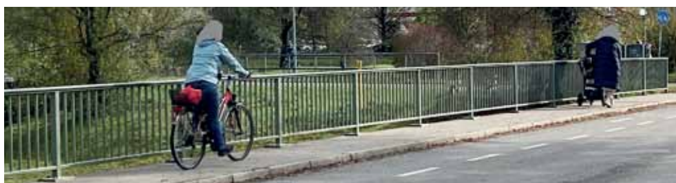
Konflikte (2): Radfahrer benutzen die Gehwege, um dem Autoverkehr bzw. den Gefahren auszuweichen. Aber da sind auch Fußgänger unterwegs.