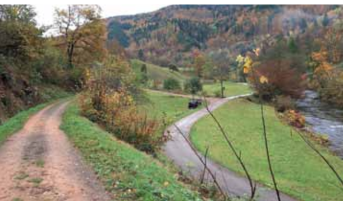
Radfahrer wollen hier freie Wahl – und wenn's gut rollen soll, eben aufs Sträßchen und nicht auf den Todtnauerli-Weg.

Die IG Velo Mittleres Wiesental trifft sich vierteljährlich. Nächster Termin: Dienstag, 20. Februar 2024. Der Ort stand bei Redaktionsschluss noch nicht fest; er wird im Netz auf www.igvelo.de zu finden sein.