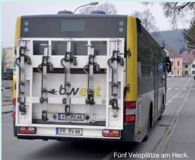
Fünf Veloplätze am Heck.

Fachkliniken: Radmitnahme gestattet (allerdings nur im Rahmen der Abstellmöglichkeiten im Fahrzeug; kein Heckträger). Die Kurse sind im Fahr-