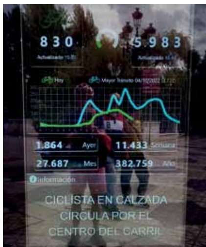
Gezählt in Burgos. Egon Zoller fotografierte diesen Radverkehrs-Zähler im September auf der Plaza Vega, vor dem Eingang in die Altstadt des spanischen Burgos. Mit aktueller Zahl, dem Radaufkommen am Tag, in Woche, Monat, Jahr – und sogar einer Grafik zum Tagesverlauf (grün) mit Vergleich zum bis dahin besten Radtag an dieser Stelle (türkis).

Brunhilde Trikes war auf Tour entlang Fulda, Diemel und Weser – und fotografierte für die VeloPost dieses schwergängige Velo vor einem Radgeschäft in Bad Karlshafen.