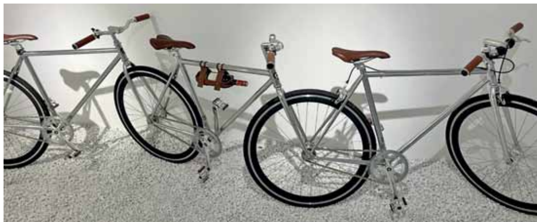
Bedingt fahrbereit. Diese Kuriosität hat Karo Krumm in Mulhouse fotografiert, im Museum Dan GERBO für Zeitgenössische Kunst – und gleich an die VeloPost gedacht.