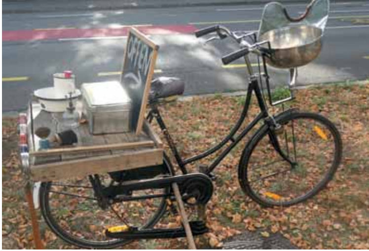
Rein zum Friseur. Rasierpinsel, Schere, Becken zum Haarwaschen, alles zu sehen in Basel am Straßenrand. Macht auf ein Friseur-Geschäft aufmerksam. Thomas Nüssle hat es entdeckt und uns das Bild gemalt.