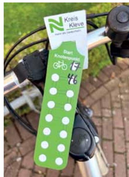
Wer mag, notiert sich seine Radknoten auf einem wetterfesten Kunststoff.

Ein Ausschnitt der Karte „Die Fahrrad-Region Kreis Kleve in Knotenpunkten“, herausgegeben von der Wirtschaftsförderung Kreis Kleve.