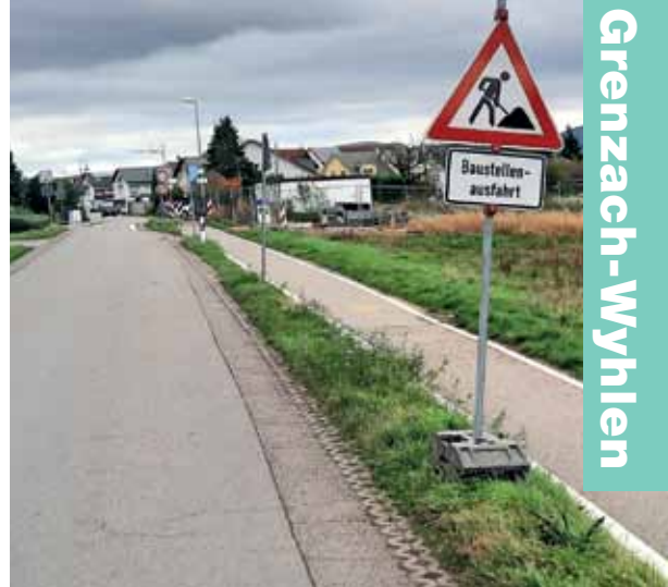
Der Weg entlang der Hardtstraße ist wieder in beiden Richtungen frei.

Die IG Velo hat sich auf jeden Fall besonders für die radfahrenden Fußwegbenutzer sehr gefreut. (aw)