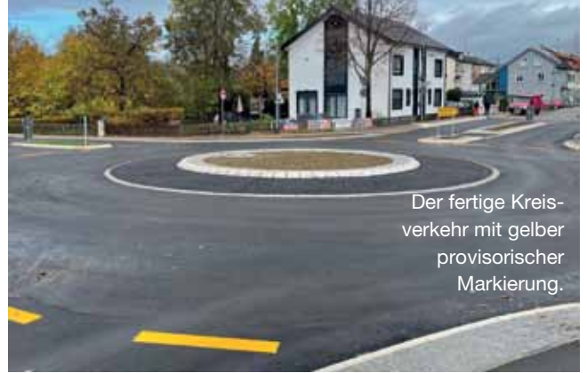
Der fertige Kreisverkehr mit gelber provisorischer Markierung.

Stattdessen findet sich eine für Radfahrende höchst unbefriedigende Zwischenlösung: Die Beschilderung verbietet die Benutzung des Fußwegs durch den Radverkehr, während gleichzeitig die Ab- und Zufahrten vom Radweg durch Bauzäune versperrt sind.