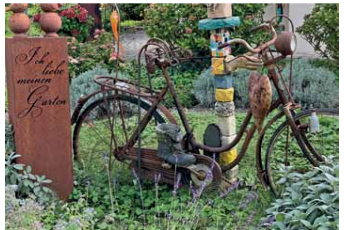
Rost im Grün. Ein Gartenliebhaber im Oberschwäbischen Salem und seine Kunst am Velo.