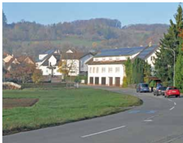
Ab Ortsende Hauingen, Richtung Zentralklinikum, wird ein Radweg neben die Straße gelegt.