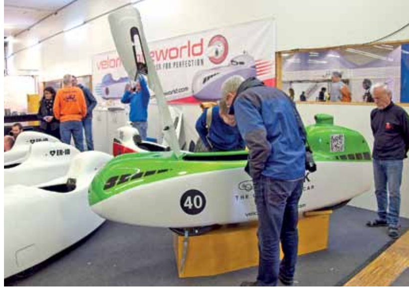
Große Modellvielfalt am Stand von Velomobileworld.