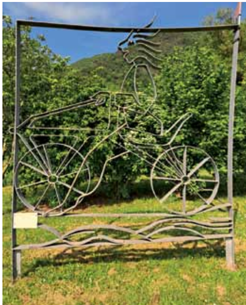
Chancenlos. Auf dem Kulturweg an der Mosel bei Mesenich entdeckte Dietmar Wiechert diesen Radler – auf einem Laufrad, flott dargestellt und hoffnungslos unterlegen jedem heutigen Bike.