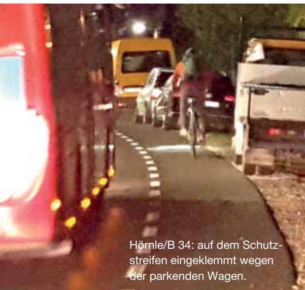
Hörnle/B 34: auf dem Schutzstreifen eingeklemmt wegen der parkenden Wagen.

Auf Nachfrage der IG Velo sollen nun zwar zusätzlich „Fahrradfahren erlaubt“- und „E-Bike erlaubt“-Schilder hinzu. Bleibt es bei einem Pfosten, werden also in Zukunft von jeder Seite drei Schilder an diesem Pfosten montiert sein. Die Nachfrage, warum nicht einfach alle Schilder weg könnten und der Weg so versperrt werde, dass ausschließlich Zweiräder durchpassen, wurde abgewunken. (fc)