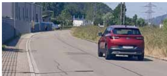
Auf der Wiesenstraße in Steinen könnte die Route des Radschnellwegs liegen – auf jeden Fall machbar, urteilt die IG Velo. Das Bild mit Radfahrer zeigt in Richtung Bahnhof, das andere den Abschnitt im Gewerbegebiet.