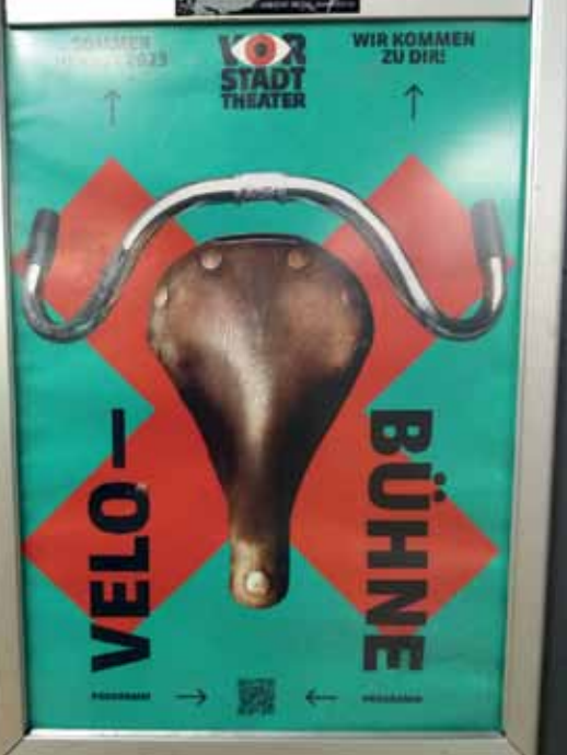
Velobühne. Das Vorstadttheater Basel ist mit einer „Velobühne“ unterwegs – den Strom erkurbelt es selbst. Yvonne Siemann hat für die VeloPost das Theaterplakat fotografiert.