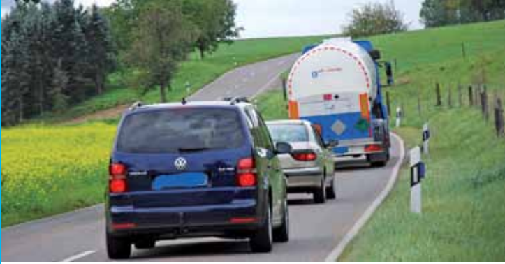
Minseln-Adelhausen: ab ins Planfeststellungs-Verfahren.