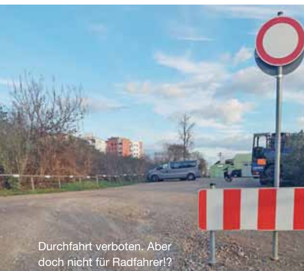
Durchfahrt verboten. Aber doch nicht für Radfahrer!?