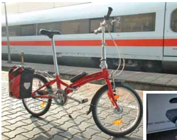
Das IG Velo-Faltrad war auch schon in Paris.

Wer Erfahrungen machen will mit Faltrad oder Lastenrad: Die IG Velo leiht beide auch aus. Das Faltrad steht allen Interessierten zur Ausleihe offen – ideal für eine Mitnahme in der Bahn. Das Lastenrad ist den Ortsgruppen der IG Velo und ihren Mitgliedern vorbehalten. Ein Nutzen des Lastenrads durch andere gemeinnützige Organisationen wäre zum Beispiel auf dem Weg einer Kooperation mit der IG Velo möglich.