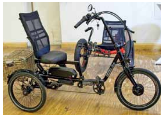
Ein Sesseldreirad (oben), kippssicherer als ein Aufrecht-Dreirad. Und das Pony 4 (unten), ein Lastenvierrad von velomo.