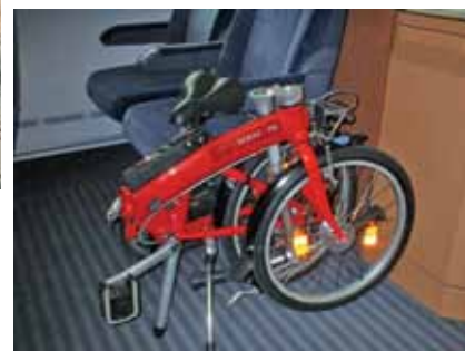
Zusammengefoldet benötigt das Dahon wenig Platz im Zugabteil.