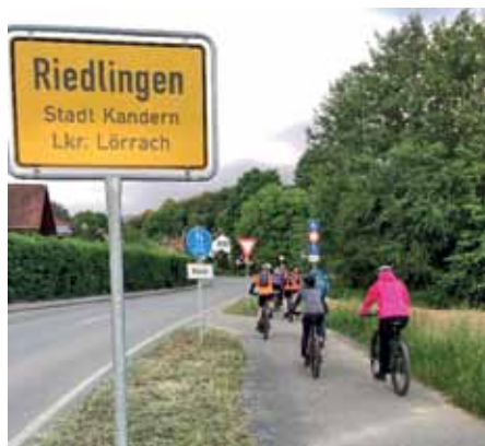
Schon hier auf die Straße? Aber ein neuer Weg führt doch weiter!

Ob man vor Riedlingen legal links auf die Straße einbiegt oder illegal neben der Straße bleibt – das wird jeder Radfahrer mit sich selbst abmachen. (tf/wg)