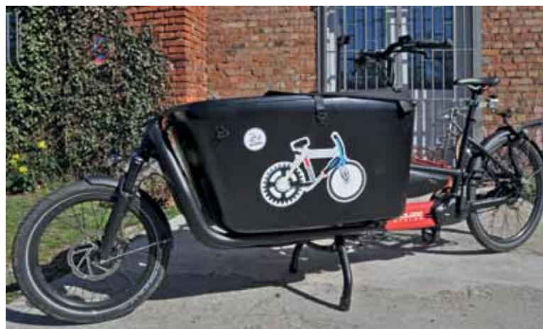
Mal ausprobieren? Das IG Velo-Lastenrad, Marke Douze mit Motor, kann ausgeliehen werden.

Das Formular ist auf den Webseiten im Bereich Service unter Faltrad und Lastenrad ausleihen abrufbar. Ein Kalender zeigt außerdem an, ob das gewünschte Rad im vorgesehenen Zeitraum verfügbar ist. (to)