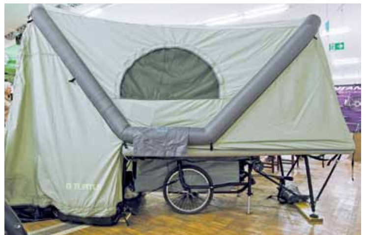
Das B-Turtle - in wenigen Minuten macht der Fahrer seinen Fahrradanhänger zum Zelt.