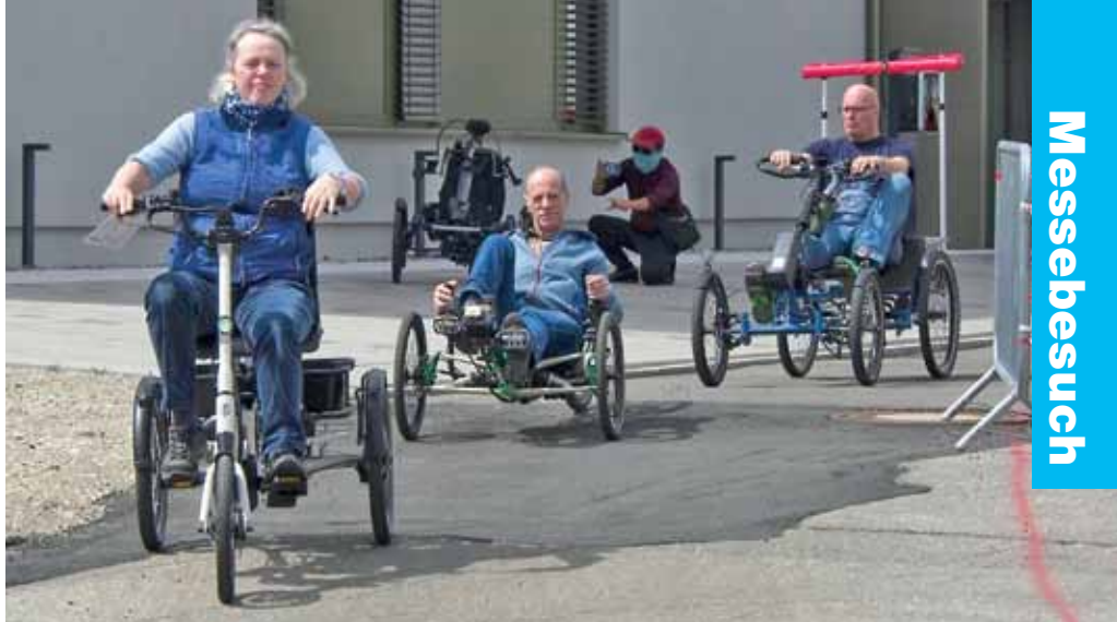
Quadvelo, alltagstauglich und wettergeschützt. Vielfalt auf dem langen Testparcours durch Hallen und Freigelände.

vertreten war die Firma Hase, die seit vielen Jahren das Thema Inklusion im Fahrradbereich umsetzt. Als Klassiker sei hier das Hase Pino genannt, ein Zweirad, bei dem der Kapitän (Lenker) in normaler Position hinten sitzt und der Stoker (Mitfahrer) vorne wie beim Liegerad auf einem Sitz mit den Beinen nach vorne mittreten kann.