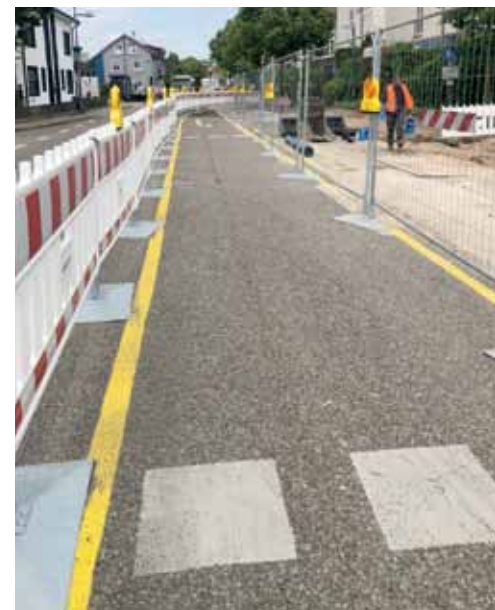
Binzen: Viel Platz für Radler bei der Kreisel-Baustelle am Ortseingang.

Aber auch in Binzen lässt die Wegweisung zu wünschen übrig. Wer die Baustelle nicht schon einmal abgefahren hat und weiß, wann und wo er in die Velospur wechseln muss, kann schon einmal die Wegführung nach Vollendung des Kreisels üben. (kdg)