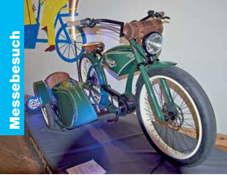
Ein echter Hingucker, nicht nur vor der Kita.