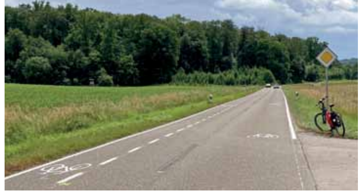
Egringen-Holzen: Jetzt wird die beste Trasse gesucht.