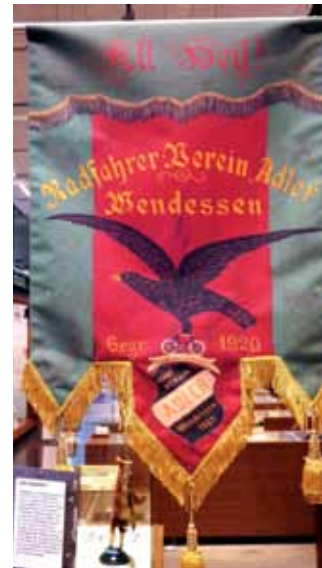
Wie Adler schnell? Ob die IG Velo auch eine schöne Fahne habe? Fragte per Mail (und gewiss mit einem Schmunzeln) Ulrich Siemann. Er fotografierte das schön gestickte Stück im Museum von Wolfenbüttel. Die Fahne gehörte 1920 dem Radfahrer Verein Adler in Wendessen – einem von vielen, die in Deutschland Ende des 19. und Anfang des 20. Jahrhunderts entstanden waren.