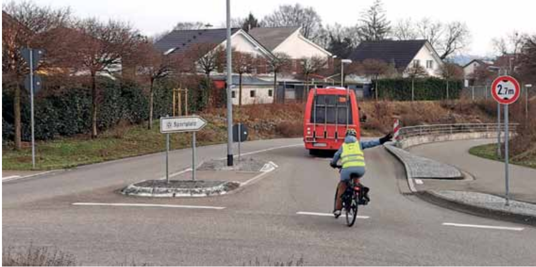
Unterführung in Wyhlen – und Radfahrer neu wirklich auf der Straße unterwegs und nicht mit auf dem breiten Gehweg?