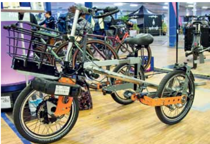
"SUV-Rollator" für unterwegs im Gelände - mit Sattel und Motor für Gehpausen.

Für Menschen mit Einschränkungen wurde eine breite Palette an Mobilitätslösungen präsentiert. Neben klassischen Rikschas fanden sich Fahrräder, an die sehr einfach ein Rollstuhl angebaut werden kann; und diverse Handbikes bzw. auch Räder, die sowohl als Fahrrad als auch als Handbike betrieben werden können; oder auch Rollatoren mit umklappbarem Sattel und E-Unterstützung. Großzügig