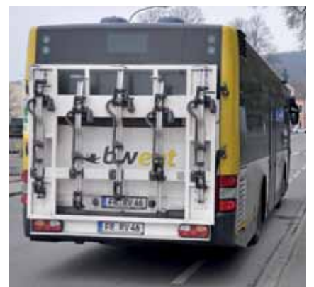
... fünf Räder haben Platz am Heck.

Länger schon kann auf der Linie 7300 Schopfheim – Feldberg – Titisee das Fahrrad mitgenommen werden, die Busse verfügen ebenfalls über einen