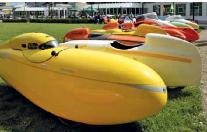
Keine SPEZI ohne Velomobile. Hier noch fotografiert auf dem alten Messegelände in Germersheim.

Zusammen mit IG Velo, Polizeipräsidium und Kreisverkehrswacht bereitet das Team Radverkehr für die Wochen des Stadtradelns eine Kampagne vor. Das Thema: „Sicherer Schulweg“. (wg)