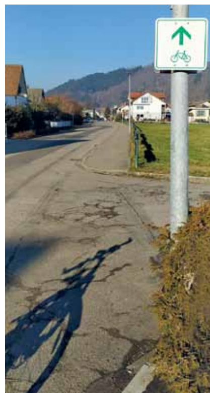
Hier passiert der Wieseradweg die Gemeinde Hausen. Bald wird das eine Fahrradstraße sein.

Die bald zur Fahrradstraße aufgewertete Route in Hausen verbindet auch Fahrnau und Zell und ist Teil des Wiesental-Radwegs. Sie wird von radfahrenden Pendlern, Schülern und Urlaubern intensiv genutzt. Sie alle können sich auf mehr Sicherheit und eine störungsfreie Durchfahrt durch Hausen freuen. (hs)