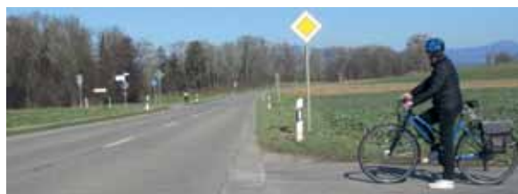
Problem Nr. 3 entsteht hier, wenn der Mais hoch steht.

Die Nr. 3. Fahren Radler westlich von Fischingen auf der Radroute zur Kreisstraße 6351 (die rechts nach Egringen führt), ganz nah dem Abzweig zu den Britschenhöfen, und wollen sie über die Kreisstraße hinweg auf den dortigen Radweg – dann sehen