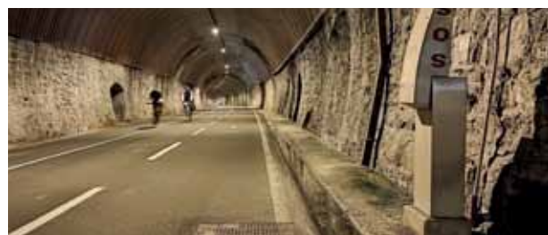
Der Küstenradweg – aus strahlendem südlichen Licht immer wieder hinein in gut beleuchtete Tunnel.

An vielen Stellen der Radstrecke können Fahrrad oder Tandem ausgeliehen werden. Anfahrt: Es gibt ab Basel-SBB Verbindungen mit Velotransport und einmaligem Umsteigen in Mailand, Fahrtzeit gut acht Stunden. Mit dem Auto braucht es sechs bis sieben Stunden.