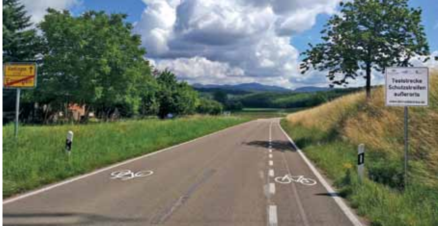
Pilotstrecke Egringen-Holzen: auf der einen Seite der Kreisstraße ein Schutzstreifen, auf der anderen Seite ist in Abständen das Fahrrad-Piktogramm markiert.