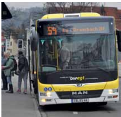
Der Sausenberger gewinnt an Wert ...

Im Landkreis Lörrach nehmen weitere Busse auch Fahrräder mit – was