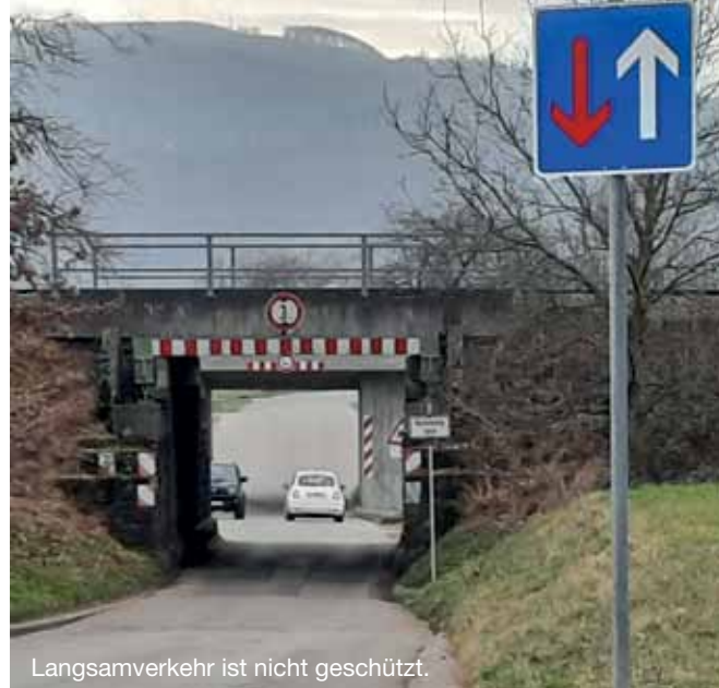
Langsamverkehr ist nicht geschützt.

In den beiden Unterführungen gibt es keinen Schutz. Und auch keine mahnenden Hinweise für Autofahrer. Die Gemeinde hat lediglich Barken an den Seiten angebracht, damit Kraftfahrzeuge nicht entlang schrammen. Weiterhin sind 50 km/h erlaubt. Und eine Änderung, das heißt ein Schutz des Langsamverkehrs, steht bislang nicht auf dem Plan der Gemeinde. (aw)