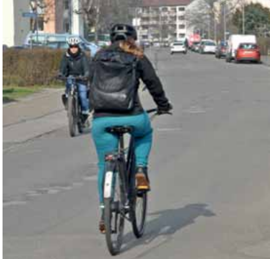
In Planung: Hartmattenstraße wird Fahrradstraße.