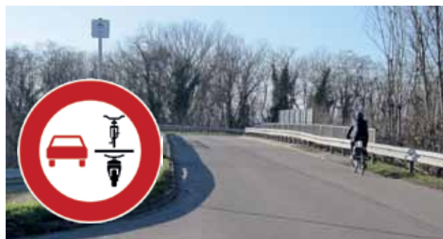
Bei Problem Nr. 4 kann ein Überholverbot helfen.

Die Nr. 4. Die Radwegbeschilderung weist vom Ortsteil Kirchen entlang der Basler Straße außerorts über die beiden bahnüberquerenden Brücken zum Radweg an der Bundesstraße 3. Diese Route wird hauptsächlich von Schülern zum Schulzentrum nach Efringen-Kirchen