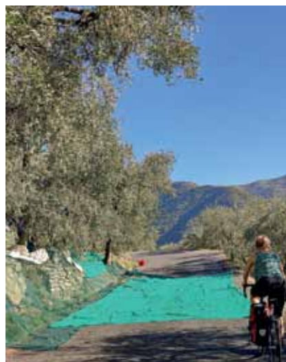
Olivenernte – kein Problem für Radfahrer.