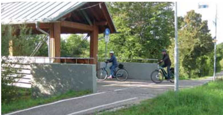
Bauen im Sommer: Bei der Holzbrücke wird der Wieseweg ausgeweitet.