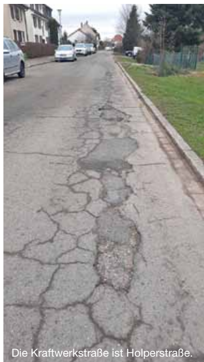
Die Kraftwerkstraße ist Holperstraße.