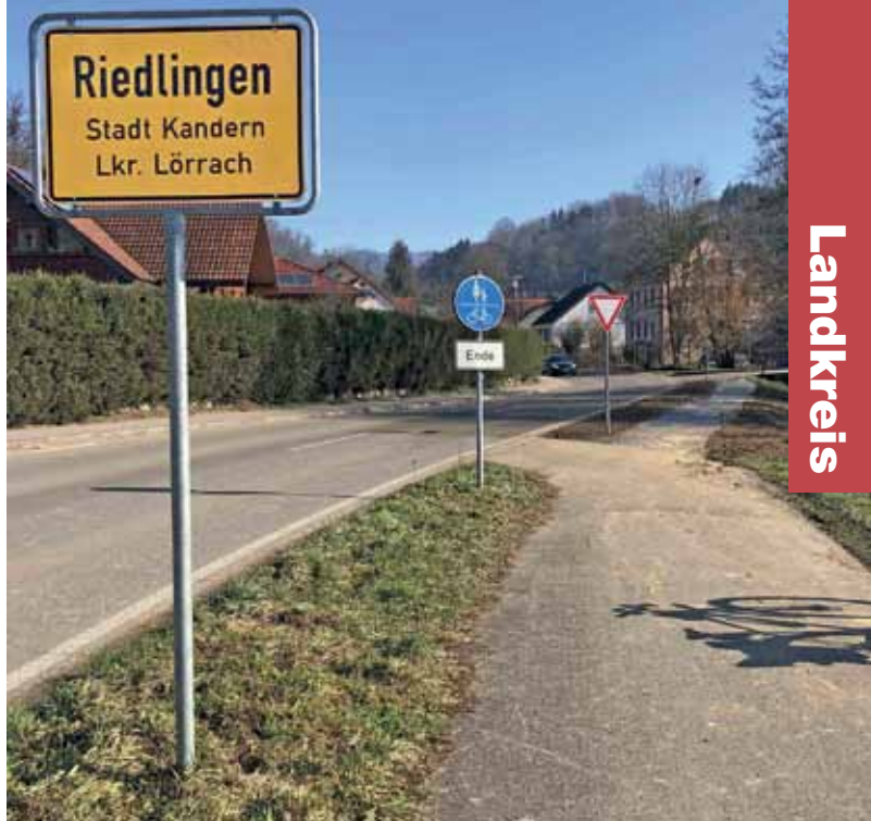
Hinter dem alten Ende-Radweg-Schild ist ein weiteres Stück Weg asphaltiert worden – das Schild aber soll stehen bleiben.

Nun freuen sich Radfahrer für die Fußgänger und entscheiden selbst, ob sie im Schritt-Tempo das neue Stück Fußweg als Radfahrer benutzen. So ganz hat die IG Velo das nicht verstanden, denn ein Fußweg existiert bereits auf der anderen Straßenseite. Aber wer versteht schon alles. (ms)