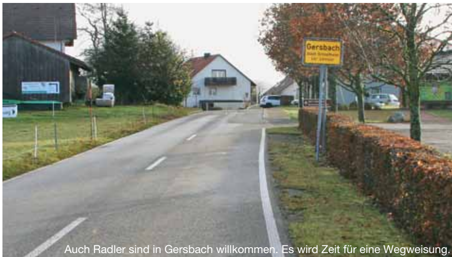
Auch Radler sind in Gersbach willkommen. Es wird Zeit für eine Wegweisung.

Die Route hinauf zur Berggemeinde ist immer noch nicht beschildert und nicht ins Radnetz aufgenommen.