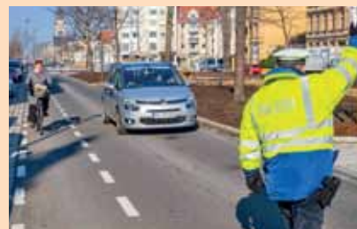
Dessau: Die Fahrbahn ist einfach zu schmal zum Überholen, also kann Überholen gebüßt werden.

Die Polizei sieht sich bisher nicht in der Lage, den erforderlichen Abstand beim Überholen von Radfahrern zu kontrollieren – geeignete Messgeräte, deren Ergebnisse auch in einem Gerichtsverfahren standhalten, gibt es noch nicht. Völlig hilflos ist die Polizei aber nicht. Siehe Dessau, wie die Mitteldeutsche Zeitung mit Foto berichtet. Denn ist eine Fahrbahn so schmal wie diese am Albrechtsplatz in Dessau, kann ein Autofahrer unmöglich mit 1,50 Abstand oder mehr einen Radler passieren. Wer trotzdem überholt, den winkt die Polizei zur Seite – macht 30 Euro Verwarngeld